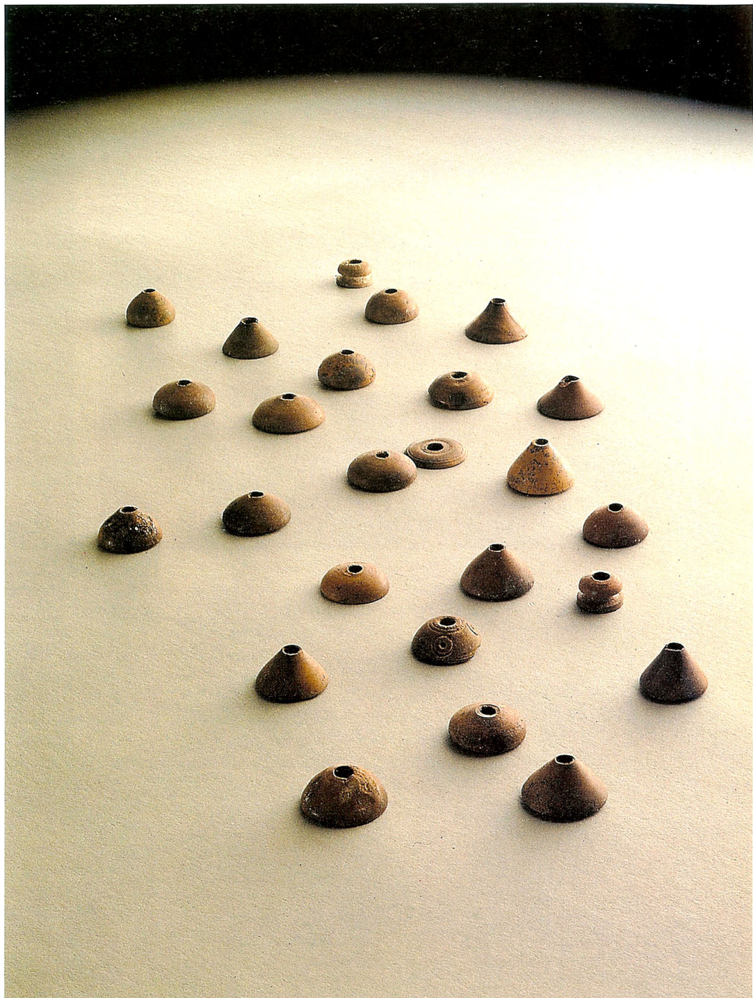
266 Lot de 25 fusaiöles Nécropole de Shakhoura, fouilles bahreïnienues 1996-97, Mont 1, Tombe 1 Phase de Tylos, 1 er s. av. J.-C. Ivoire H 0,2 à 0,9 D MAX. 1 à 1,8 cm Manama, Musée national de Bahreïn, inv. n° 397-3-12 Inédit