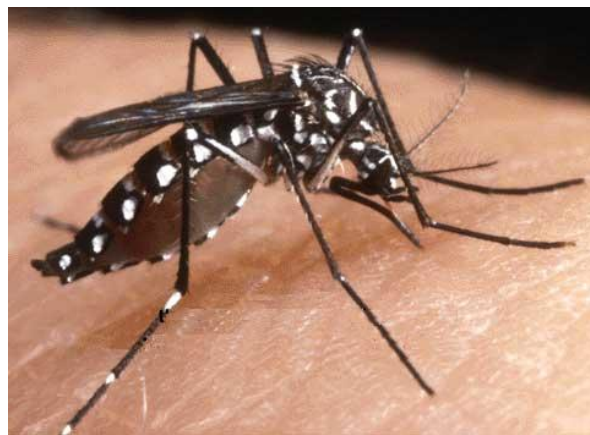
Photos 1. Aedes albopictus en action. Il est facilement reconnaissable à son corps noir rayé de blanc.

articulations après une phase de fièvre et de courbatures et d'éruptions cutanées, s'ajoute l'inquiétude d'éventuelles séquelles notamment pour les plus jeunes et dans les cas les plus extrêmes de la mort directe ou indirecte causée par le virus. Le vecteur de transmission du virus à l'homme est le moustique de la famille Aedes et notamment Aedes aegypti , Aedes africanus et dans le cas de La Réunion Aedes albopictus . Ce moustique est aussi porteur de la dengue, autre maladie virale présente à La Réunion 3 .