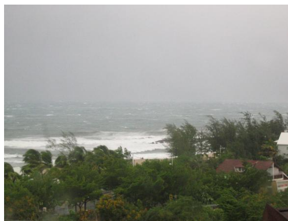
Photo 2. La tempête tropicale Diwa le 05 mars 2006, vue sur Boucan Canot

Diwa, tempête tropicale qui a sévi sur La Réunion du 05 au 07 mars 2006, a été remarquable pour l'intensité des pluies. Météo France, dans son bilan 25 sur Diwa, précise que les valeurs maximales de pluviométrie se rapprochent de celles du record mondial de précipitations en 3 jours établi en janvier 1980 à Grand-Ilet, île de