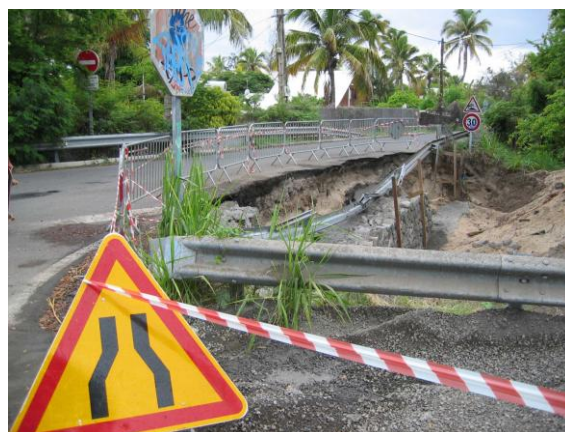
Photo 3. Exemple des dégâts occasionnés à La Réunion (Grand Fond) lors de la tempête tropicale précédente du 18 au 23 février 2006