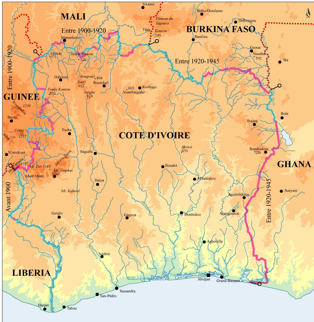
Figure 1: SUPPORTS ET DATES APPROXIMATIVES DU TRACE DES FRONTIÈRES IVOIRIENNES

Conception et réalisation: Désiré Nassa, Dymset, Octobre 2004