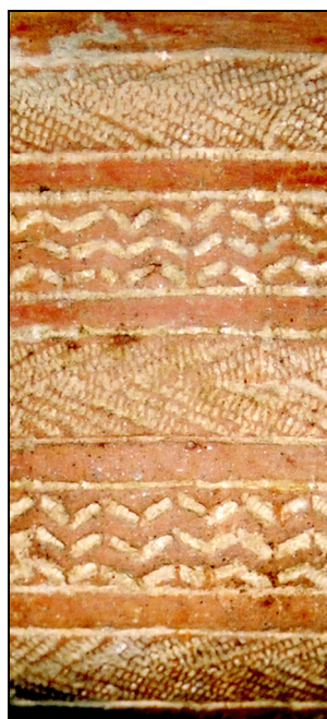
Fig. 9 : Décor de gobelet campaniforme d'Europe centrale (République tchèque).

C'est cette ambivalence du phénomène qui est sans doute le fait le plus intéressant. Si toute période peut être considérée, d'une façon ou d'une autre, comme un moment de transition entre ce qui la précède et ce qui la suit, l'expression est particulièrement bien adaptée au Campaniforme. Il s'agit incontestablement d'un phénomène de nature historique qui contribue à la transformation et à l'évolution des sociétés de façon profonde et durable, même si les hommes de l'époque, dans leur vie quotidienne, n'en ont pas eu réellement conscience.