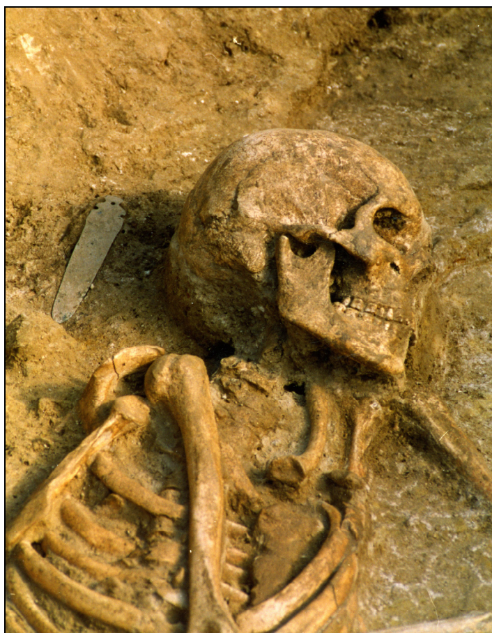
Fig. 6 : Sépulture de La Fare (Forcalquier, Alpes-de-Haute-Provence), détail. Le poignard de cuivre déposé derrière la tête de l'individu inhumé rappelle l'importance des débuts de la métallurgie dans le Midi de la France au 3 e millénaire et la relation qui existe entre la diffusion campaniforme et celle des pratiques métallurgiques. (fouilles et photo : O. Lemerrier et A. Müller)

surtout par les deux grandes cultures de Los Millares en Andalousie et de Vila Nova de Sao Pedro au Portugal. L'Italie n'échappe pas à la règle du morcellement avec une série de groupes culturels définis comme énéolithiques et propres à chaque région (Céramique métopale, Énéolithique toscan, Rinaldone, Laterza...), le groupe de Malpasso en Sicile, celui de Monte Claro en Sardaigne et le Terrinien en Corse. Dans les îles britanniques, Grande-Bretagne et Irlande, la première moitié du troisième millénaire est surtout rapportée à la Grooved Ware Culture, mais celle-ci est aussi divisée en de multiples faciès régionaux. C'est donc une très grande variété de contextes que va rencontrer le phénomène campaniforme lors de sa diffusion, pouvant expliquer des réactions locales diverses, des intégrations différentes, voire des rejets partiels ou complets.