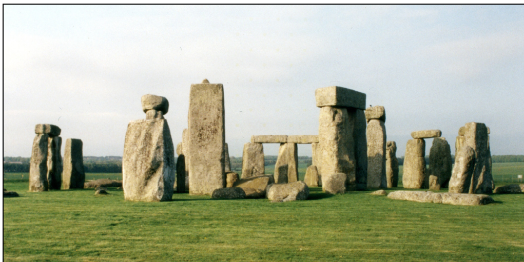
Fig. 1 : Le site de Stonehenge (Angleterre) est probablement le monument le plus célèbre de la fin du Néolithique. Si le premier aménagement (fossés) peut être daté autour de 3000 avant notre ère illustrant la monumentalité de la fin du Néolithique en Europe occidentale, c'est à partir de la période campaniforme, dans la seconde moitié du 3 e millénaire, qu'est érigé le grand monument mégalithique central.