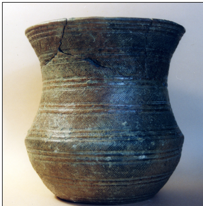
Fig. 7 : Gobelet campaniforme de La Fare (Forcalquier, Alpes-de-Haute-Provence). Le décor réalisé au peigne et à la cordelette est caractéristique de la phase ancienne du Campaniforme. Il s'agit probablement d'un objet échangé par des campaniformes et retrouvé dans un contexte indigène.

La fin du Campaniforme avec la mise en place dans le Midi de la France des céramiques à décor barbelé met en lumière l'existence d'autres dynamiques en rupture avec ces voies principales de diffusion du Campaniforme. C'est en effet vers l'Italie et, au-delà, vers le nord-ouest des Balkans qu'il faut chercher l'origine probable de ces céramiques. Les morphologies faisant essentiellement référence au domaine italique de la fin du Néolithique et du Campaniforme et la technique du décor barbelé, très spécifique au moyen d'un peigne fileté, renvoyant directement à des productions non campaniformes du troisième millénaire de la région de Ljubljana en Slovénie (Dimitrijevic, 1967).