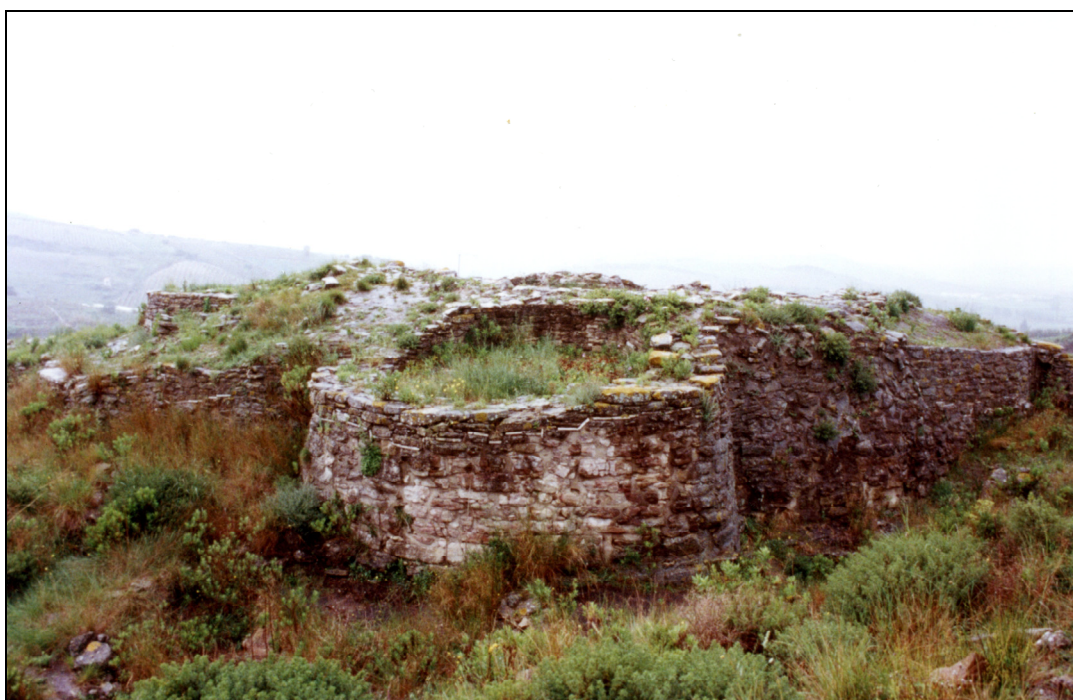
Fig. 2 : Le site de Zambujal (Portugal), caractéristique du développement des habitats fortifiés de la culture de Vila Nova de Sao Pedro, est construit et transformé tout au long du 3 e millénaire. Il a livré de nombreux vestiges campaniformes et montre, sans doute, le monde dans lequel le phénomène campaniforme est apparu.

Cette définition du Campaniforme (des gobelets décorés associés, dans des sépultures individuelles, à des armes et des parures d'os, de cuivre et d'or et à l'équipement de l'archer. L'ensemble se répandant rapidement à l'Europe entière) a conduit les archéologues à considérer le phénomène campaniforme comme une énigme sur laquelle les chercheurs travaillent depuis maintenant plus d'un siècle.