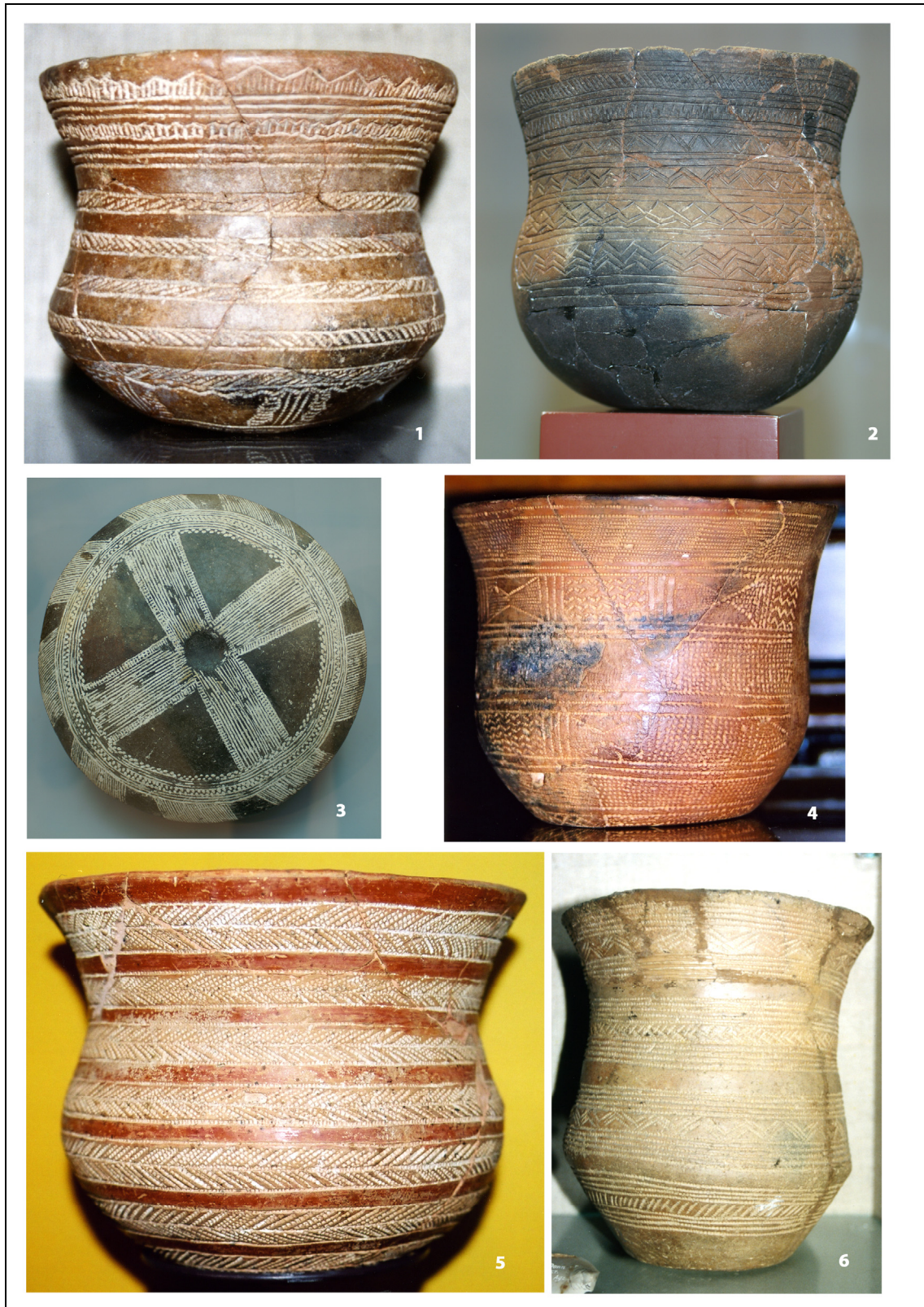
Fig. 8 : Vases campaniformes : 1 – Portugal, 2-3 – Espagne centrale, 4-5 – République tchèque, 6 – Angleterre.