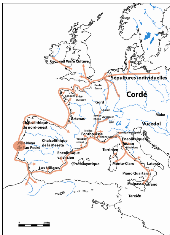
Fig. 3 : Carte de la diffusion du Campaniforme à travers l'Europe, selon l'hypothèse portugaise, autour de 2500 avant notre ère. Les noms indiqués correspondent aux cultures locales de la fin du Néolithique dans les différentes régions au moment de l'expansion campaniforme. (O. Lemerrier)

évidente à de multiples origines (Gallay, 1997), témoignant avant tout de l'existence d'un système d'échanges ou de déplacements important et complexes à travers l'Europe dans la seconde moitié du troisième millénaire avant notre ère.