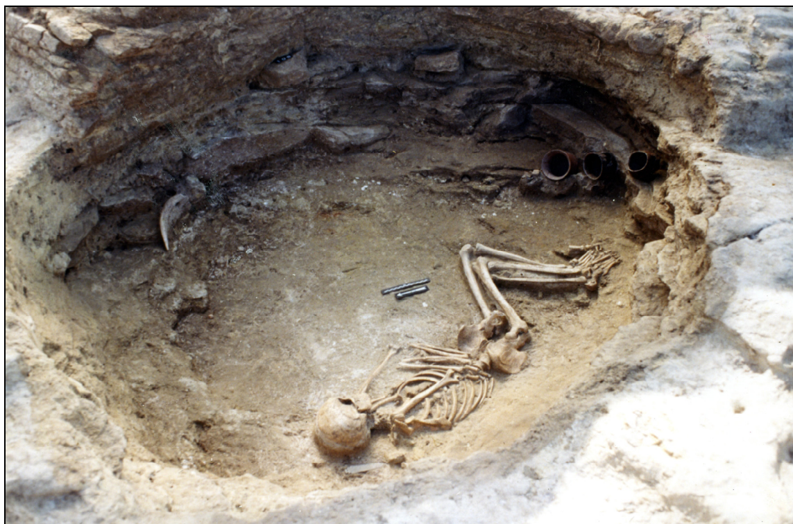
Fig. 5 : Sépulture de La Fare (Forcalquier, Alpes-de-Haute-Provence) illustre la diffusion campaniforme en France méditerranéenne. Il s'agit probablement de la sépulture d'un indigène, inhumé avec des gobelets de la tradition locale Rhône-Ouvèze mais aussi un gobelet campaniforme et selon des rites (position, orientation, mobilier) étranger à la région. (fouilles et photo : O. Lemerrier et A. Müller)

la diffusion campaniforme que la pratique métallurgique elle-même va se répandre et s'implanter dans ces mêmes régions, voire même supplanter les techniques métallurgiques issues des traditions locales anciennes.