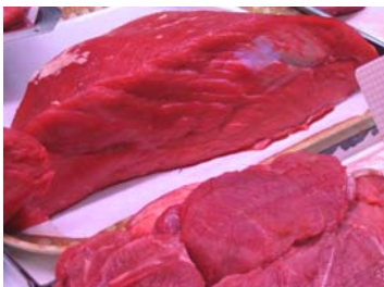
Pour les personnes interrogées, la viande halal a meilleur goût que la viande non halal.