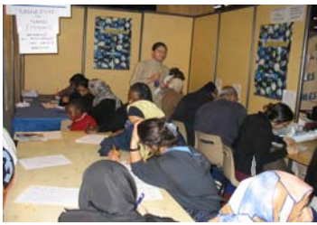
Quatre jours d'enquête dans un stand loué à l'UOIF en Mars 2005

Avant de présenter ces premiers résultats, quelques remarques préliminaires sur les limites d'une telle enquête :