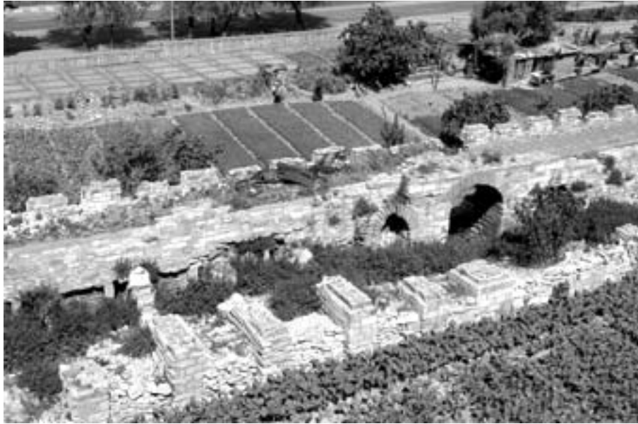
Zone de jardins vers Belgradkapı(@FD)

d'apprentissage de la citoyenneté, et d'une nouvelle condition individuelle. L'errance et la misère côtoyant là des processus d'émancipation et de construction.