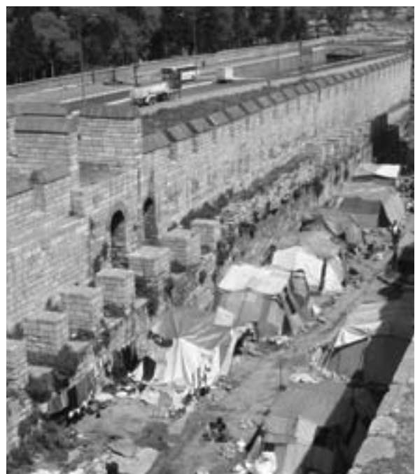
Campement rom à Mevlânakapı

Le saisissement de la muraille peut aussi renvoyer à une tension politique, comme dans les conflits entre le pouvoir (municipal et national) et les Kurdes. En 2001, une célébration informelle et populaire du nouvel an s'est déroulée en marge des manifestations officielles encadrées. Elle était, comme chaque année, interdite. Elle eut lieu pourtant, au pied des murailles, dans un endroit symboliquement fort : lieu de présence kurde dans la journée à travers un commerce de rue régulièrement expulsé par la police puis qui se réinstalle, la porte de Topkapı voisine aussi avec un important nœud routier, très visible et fréquenté, récemment réaménagé par la municipalité. L'endroit rappelle encore les Émeutes de 1997, lorsque la police et l'armée avaient dû chasser les derniers occupants d'un « grand bazar