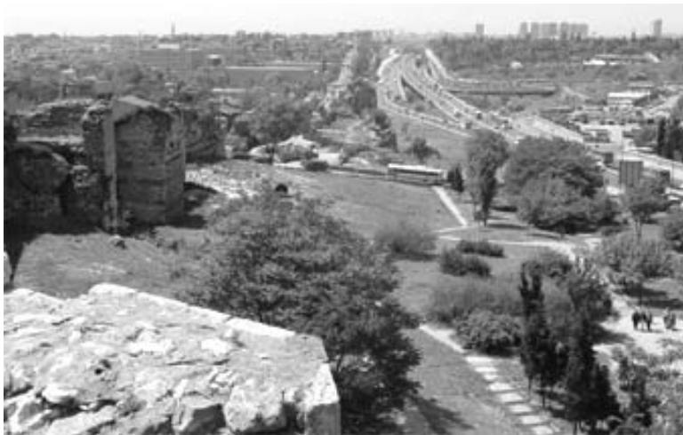
La muraille vue d'Edirnekapi

abords de la muraille : maillage urbain serré côté ville historique, habitée en majorité par des classes populaires ; vaste zone verte non-aedificandi côté ouest vers l'extérieur, avec de nombreux cimetières turcs, arméniens ou grecs.