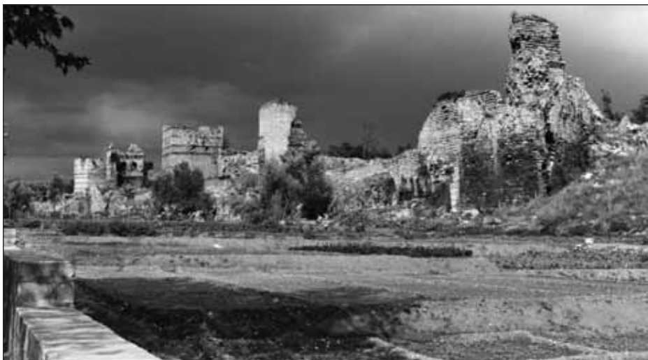
Les tours et le jardin à l'extérieur de la muraille Théodose II (Turquie).

Les visiteurs plus curieux, ou qui disposent de plus de temps, s'approchent pourtant parfois très près de la muraille de Théodose II : la Kariye, ancienne basilique Saint-Sauveur-in-Chora, petit édifice remarquable dont les mosaïques rivalisent avec Sainte-Sophie, n'est située qu'à quelques centaines de mètres d'Edirnekapi et du Tekfur Saray. Ceux qui prennent le temps d'arpenter la Corne d'Or vers Eyüp, en quête du site du pèlerinage voué au compagnon du prophète ou du café Pierre Loti, juché sur le promontoire surplombant l'ancien et immense cimetière musulman arboré, ne font que rarement le détour par le donjon d'Anemas, pourtant tout proche et bien visible. Les plus audacieux, qui iront, à l'opposé, manger du poisson sur les rives de la mer de Marmara et se promener sur les espaces aménagés entre la route et l'eau, pourraient être guidés par les derniers vestiges du rempart maritime pour atteindre les premières tours de la partie terrestre, mais cela s'avère encore plus rare sur cette portion.