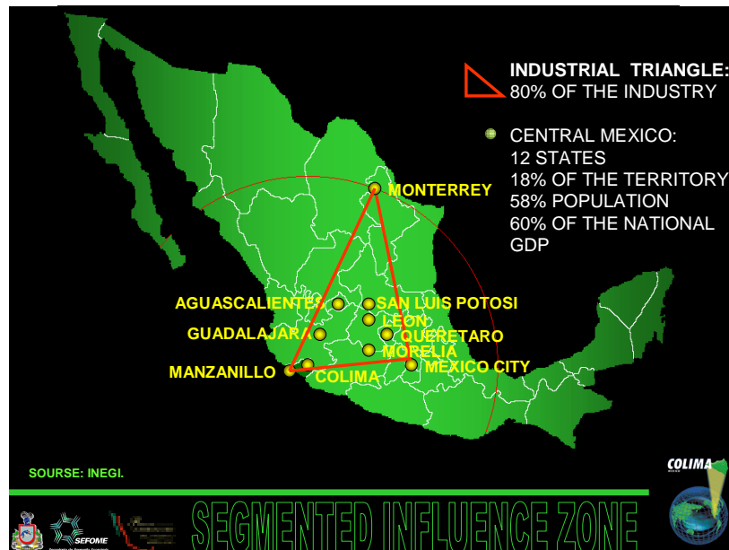
MAPA N° 2. TRIANGULO INDUSTRIAL EN MÉXICO

Con la firma del TLCAN (1994) en esta frontera se inicia su desdibujamiento, en función del reacomodo de la actividad industrial; es decir, ya no es necesario ubicar en un mismo espacio geográfico la producción de los mercancías, por lo que los estados fronterizos tradicionales —Baja California, Sonora, Chihuahua, Durango, Coahuila y Nuevo León— ya no son los que constituyen la primera frontera comercial sino México, Morelia, Querétaro, León, San Luis Potosí, Monterrey, Aguascalientes, Guadalajara y Colima, en función de que en éstos se desarrolla la mayor actividad industrial del país (ver mapa N° 2).