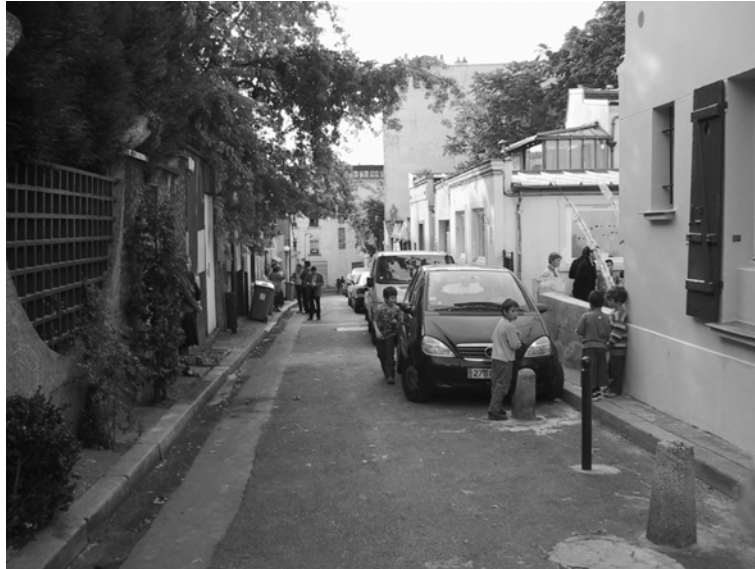
Cliché 1 : La villa de l'Ermitage

d'autre part sur l'enrichissement personnel qu'apporte la mixité sociale. Ce sont précisément les arguments utilisés par l'une des plus grandes figures du retour à la rue, Jane Jacobs.