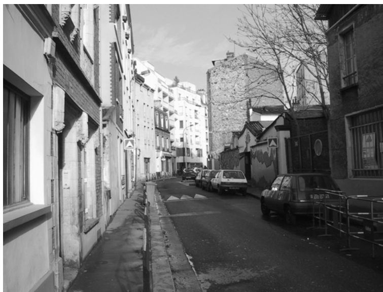
Cliché 3 : Rue de l'Ermitage.

Les gentrificateurs qui jouent un rôle décisif dans le changement d'image de Belleville sont avant tout ceux qui occupent le parc privé ancien réhabilité. Les vieux immeubles et les vieilles maisons correspondent mieux aux environnements urbains qu'ils valorisent. Les raisons de cette préférence ne sont pas seulement paysagères, elles sont aussi éthiques : les valeurs d'authenticité et de convivialité dont ils se font les porteurs s'accordent mal avec des rénovations brutales. Ces gentrificateurs acceptent difficilement l'idée de s'installer sur les décombres des anciens faubourgs : comment en effet prétendre rechercher l'ambiance propre aux quartiers populaires en emménageant dans un immeuble neuf construit à la place d'un immeuble de rapport dont les occupants ont été expulsés ? Leur mauvaise conscience est d'autant plus grande que la contestation de l'urbanisme moderne s'est largement nourrie de la dénonciation des déstructurations sociales occasionnées par les rénovations. Plusieurs associations bellevilloises ont d'ailleurs repris ce thème pour lutter contre les projets immobiliers des promoteurs et de la mairie (Lidgi, 2001).