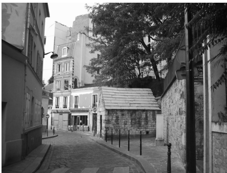
Cliché 2 : Rue des Cascades

Une vue dont le pittoresque explique en partie l'intérêt porté au secteur par l'administration parisienne et par Antoine Grumbach.