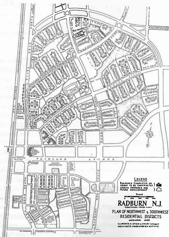
Figure 1. Plan de Radburn, New Jersey, Clarence Stein & Henry Wright, 1929 (in C. S. Stein, Towards New Towns for America , Cambridge, MIT Press, 1966, p. 43 ; cité par C.L. Girling & K.I. Helphand, Yard, Street, Park , p. 61).

chaque résidence ouvrait sur des espaces verts et sur des circulations piétonnières censées constituer l'épine dorsale du lotissement. Groupées par dizaines ou par douzaines, les impasses résidentielles formaient ce que Stein appelait des superblocs . Le trafic de transit était rejeté à l'extérieur de ces derniers, sur les voies artérielles qui les entouraient 4 . Comme Colin Buchanan le reconnut lui-même 5 , ces idées furent reprises quasiment à l'identique une trentaine d'années plus tard dans le rapport qui porte son nom et qui constitua l'acte de naissance des fameuses « aires environnementales » (voir Figure 3).