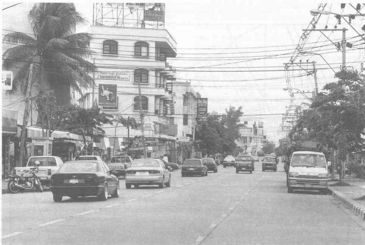
Photographie 3. L'avenir possible du soi Charœn Phon. Il s'agit du soi Nakniwat, près de son intersection avec le soi Sahakon 3.

nuant à s'occuper de ses enfants. Ces derniers peuvent d'ailleurs l'assister dans son travail.