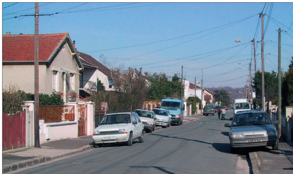
Un lotissement typique de ceux nés au début du vingtième siècle

Evidemment, la réalité oppose quelques résistances à un tel projet. Un premier type d'obstacles se trouve dans la structure du réseau viaire. Tout d'abord, les distances sont souvent trop importantes. Quand le centre bourg est éloigné de deux voire trois kilomètres de la gare, il paraît difficile de constituer un itinéraire commerçant continu, surtout dans un contexte dominé par l'habitat pavillonnaire. Il faut alors gérer des discontinuités. Les modalités de cette gestion restent à trouver. Par ailleurs, la structure de la trame viaire ne se prête pas toujours à la formation d'un itinéraire simple et direct entre le centre bourg et la gare : des détours peuvent être nécessaires. Ainsi, le centre du lotissement ne se trouve pas toujours en liaison avec l'itinéraire le plus court entre le bourg et la gare. De même, la rue commerçante principale du bourg n'est pas toujours dans l'axe de la gare.