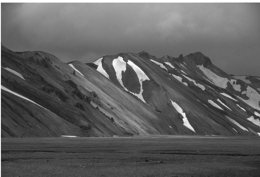
Figure 4. Eboulis rhyolitiques, Landmannalaugar.

On remarquera le déchaussement des dykes au sein des versants. Juillet 1994