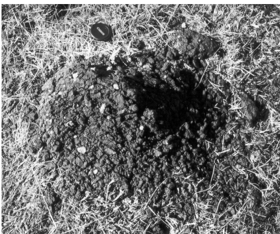
Figure 6. Pulvérisation des hyaloclastites par le gel, Krakatunga, Vik-i-Myrdal, mai 1997.

La comminution de la matrice hyaloclastitique fournit une grande quantité de limons, tandis que les inclusions basaltiques, de granulométrie variable (mode : graviers), sont relativement épargnées par le gel. Une ségrégation progressive par les alternances de gel/dégel aboutit à la formation de sols striés dont les bandes grossières sont constituées de fragments basaltiques et les bandes fines de hyaloclastites.