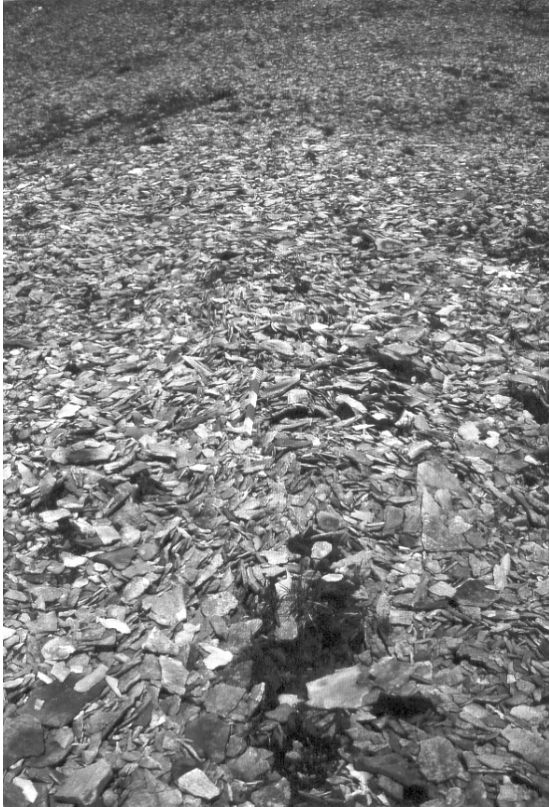
Figure 5. Dallage de gelifractes sur les interfluves convexes rhyolitiques, Landmannalaugar.