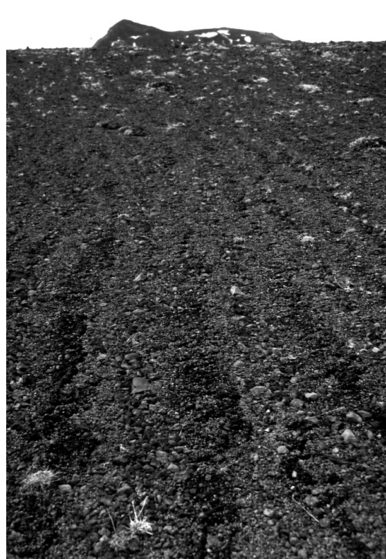
Figure 7. Sols striés sur le plateau de Skogaheidi, mai 1997.

La comminution de la matrice hyaloclastitique fournit une grande quantité de limons, tandis que les inclusions basaltiques, de granulométrie variable (mode : graviers), sont relativement épargnées par le gel. Une ségrégation progressive par les alternances de gel/dégel aboutit à la formation de sols striés dont les bandes grossières sont constituées de fragments basaltiques et les bandes fines de hyaloclastites.