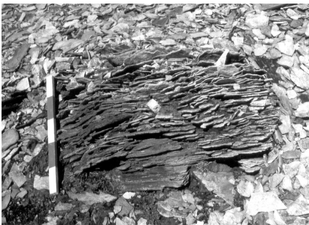
Figure 3. Débitage en plaquettes des rhyolites, Landmannalaugar, juillet 1997.