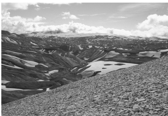
Figure 2. Le massif rhyolitique du Landmannalaugar.

Autre faciès particulièrement fissile, la hyaloclastite est une roche basique à faciès bréchiq produite lors d'éruptions subaquatiques. En Islande, ce mode d'éruption était fréquent lors des phases glaciaires (éruptions sous-glaciaires), elles furent suivies (ou précédées) de phases éruptives subaériennes lors des interglaciaires. Les éruptions sous-glaciaires peuvent donner naissance à des montagnes-