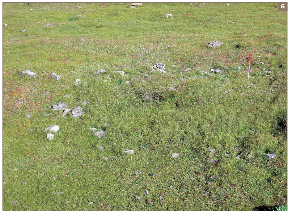
6 Vestige d'une structure située en contrebas du col, au-dessus du lac Verney.

Cependant sur le profil établi à Torverraz (2280 m) et au lac du Dessus-Verney (2300), on ne retrouve pas l'élévation du nombre des marqueurs du pastoralisme qui s'était affirmée à l'âge du Bronze final, période de la première anthropisation. L'altitude est sensiblement plus élevée. Mais la zone était attrayante pour les troupeaux si l'on en juge par l'importance des cabanes pastorales d'époque moderne et contemporaine. L'absence de trace d'une « seconde anthropisation » réside probablement dans l'éloignement de ce secteur par rapport à la route et surtout par rapport aux bâtiments d'accueil des voyageurs. Le double usage de la zone pastorale située entre l'hospice et le col explique donc probablement la différence existant entre la zone du col et le reste de la montagne (fig. 3). La diversité des situations observées est manifestement liée à la multiplication des sondages. En Champsaur, dans un contexte climatique et géographique différent, M. Court-Picon a mis en évidence une mosaïque de paysages qui correspond à celle du peuplement. Ce type d'observation ne surprend pas et confirme l'idée d'un paysage qui n'a pas été affecté par une intensification systématique de l'exploitation des ressources naturelles.