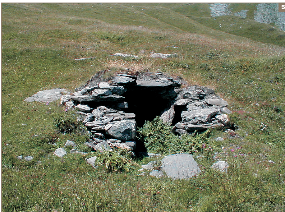
5 Structure visible sur le site de La Combe (2200 m) (Sééz).

Les données attribuées à la période romaine correspondent à un changement d'intensité dans l'occupation du col. Au