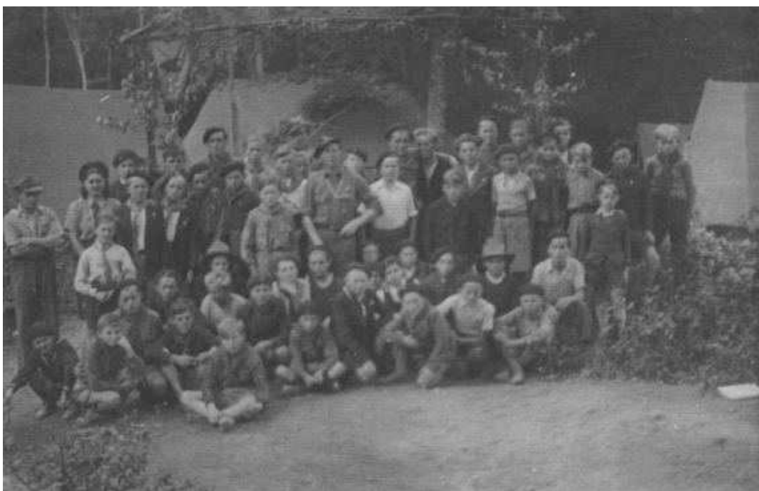
Scouts polonais de Rosières en séjour à La Rochemillay (Morvan) 1946

Le recrutement de Portugais, d'Africains du Nord, de Russes, se solde par un échec, seule la greffe polonaise prend. Il faut dire qu'une main d'oeuvre catholique et féconde abritant quelques individus vigoureux - ce sont des travailleurs de force que recherche l'usine - ne pouvait que plaire au patronnat local qui parvient à retenir, malgré la très grande volatilité de cette main d'oeuvre, quelques centaines de familles. Leurs membres trouvent là un emploi sûr, une autorité susceptible de négocier leur intégration à la société française et un environnement mi usinier mi rural moins dépaysant que la grande ville et surtout leur permettant de trouver, du fait de leurs compétences de paysans, d'indispensables compléments à des salaires qui restent maigres. Tirant le meilleur partie du lopin qui leur est alloué, ils élèvent fréquemment quelques bêtes, envoient les enfants glaner, voire s'emploient, après leur travail à l'usine, dans les fermes du voisinage. Enfin une petite Polonia se recrée à Rosières, avec ses organisations, son club polonais, fier de sa bibliothèque, un groupe de scouts, une équipe de football aussi, une école polonaise enfin, qui fonctionnera jusqu'au début des années cinquante et offre à ces familles dont la plupart entendent rentrer en Pologne, la garantie d'une éducation polonaise des enfants.