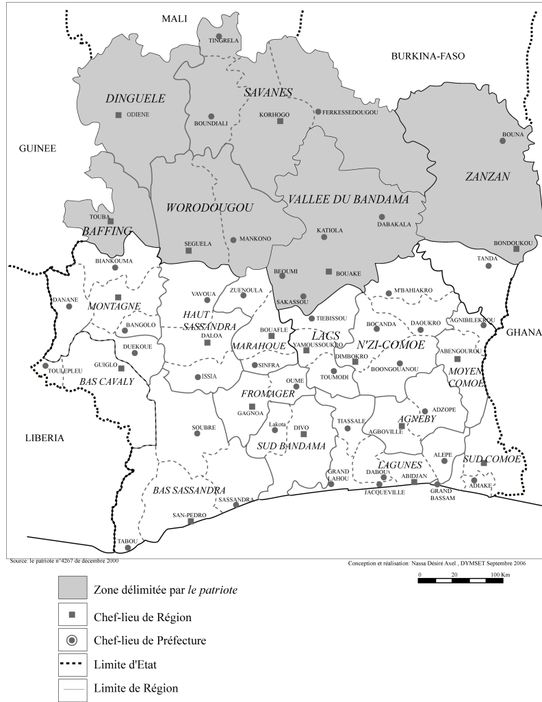
Fig 1: La division de la Côte-d'Ivoire par le patriote en décembre 2000

Ce flagrant découpage hasardeux de la Côte-d'Ivoire était une manière de préparer la conscience collective à accepter une éventuelle partition du pays, sur les bases d'une contestation des décisions de la cour suprême suite à l'invalidation de la candidature de Alassane Ouattara à l'élection législative de 2000, en application de la loi électorale 2 . Cette esquisse de limite de cession enserrait l'ensemble des zones où le RDR avait une assise électorale forte et sûr d'y remporter la quasi-totalité des sièges à pourvoir à l'assemblée nationale.