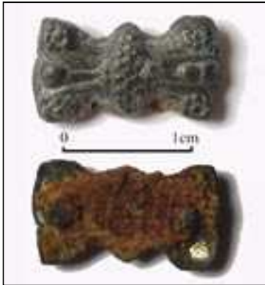
CETTE APPLIQUE DÉCORATIVE montrée sur les deux faces est en laiton jaune. Sa couleur ressemblait à celle de l'or, comme en témoigne le point où la corrosion a été abrasée (en bas).