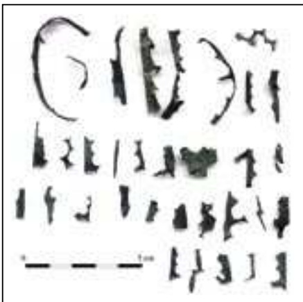
DES CHUTES DE DÉCOUPE de tôles en alliage cuivreux ont été retrouvées en très grand nombre. Elles témoignent de la fabrication de paillettes destinées à être cousues sur les vêtements.

renvoient l'image d'une petite « usine ». Nous avons donc retrouvé la trace d'un petit industriel, plutôt que d'un artisan attaché au règlement de son métier et à une clientèle de proximité. La recherche de la rentabilité, la rationalisation de la production et du travail, enfin la variété des produits témoignent d'un fabricant soucieux de répondre à la demande de produits à la mode d'une population urbaine, à des prix moins élevés que ceux pratiqués par les orfèvres parisiens. ■ N. T. et D. B.