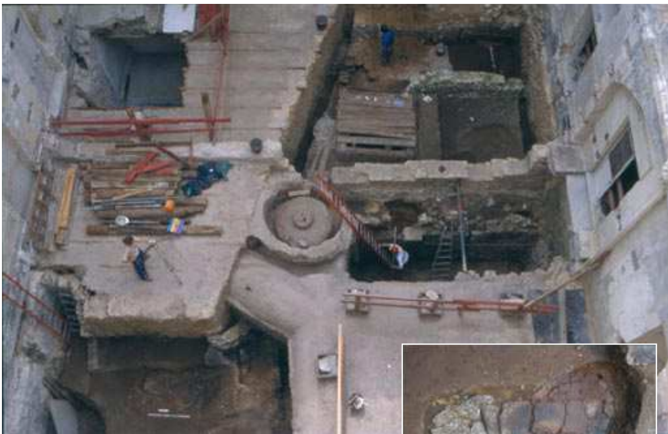
L'HÔTEL DE MONGELAS, qui subsiste aujourd'hui, a pour l'essentiel été construit aux XVII e et XVIII e siècles. Les aménagements qui se sont succédé à cet endroit depuis le XV e siècle ont bouleversé les vestiges de l'atelier médiéval. Le fond du four qui servait à fondre le bronze (ci-contre) a toutefois été retrouvé.