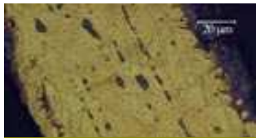
LA COUPE D'UNE PAILLETTE en tôle, vue au microscope, révèle que l'objet a subi des recuits lors de sa mise en forme. Les « chapelets » d'inclusions (en noir) indiquent la direction de la déformation.

rythme déterminé, peut-être mensuel, devaient impliquer, en une seule journée, la fonte de quelques centaines de kilogrammes d'alliage.