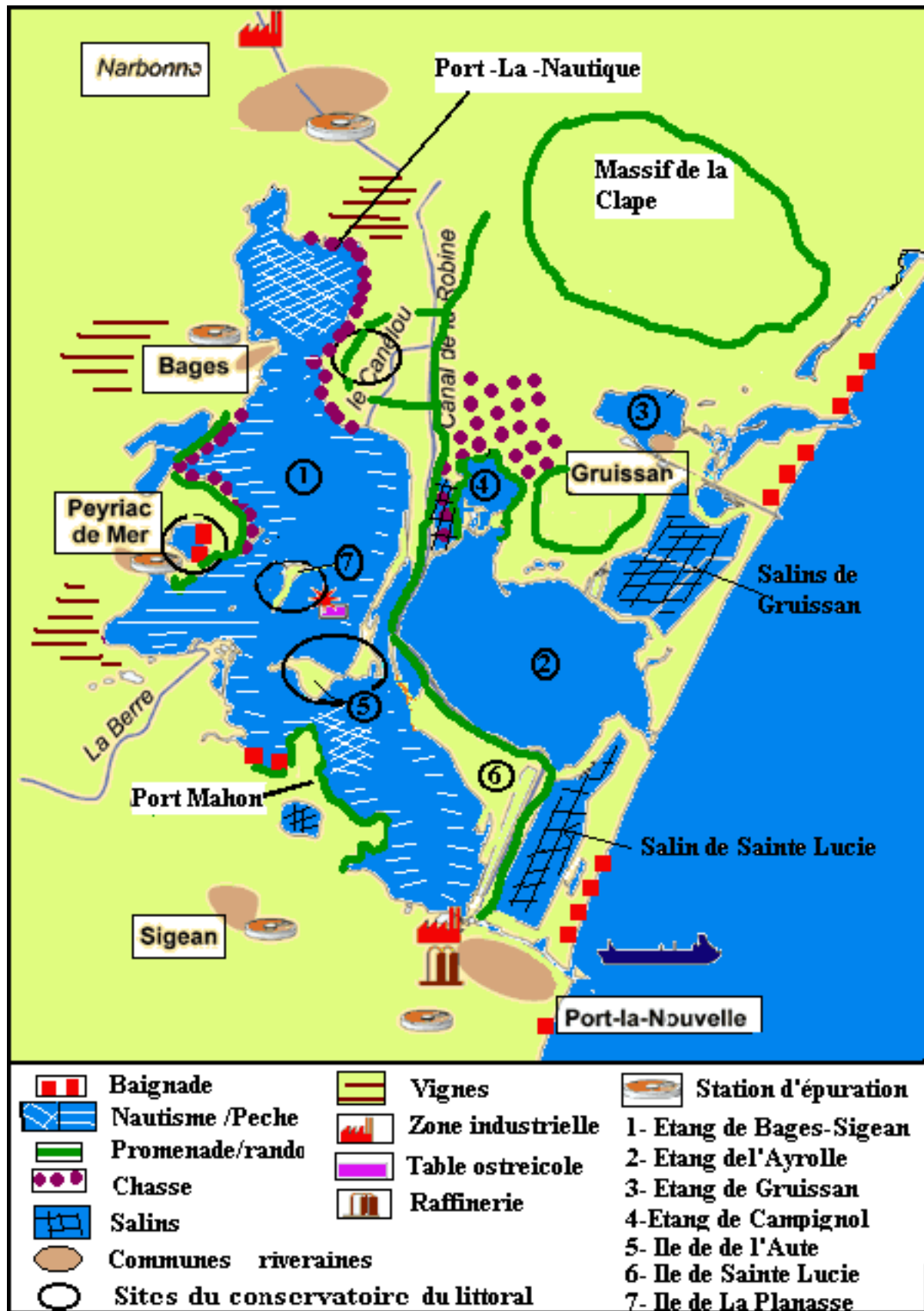
Figure B : Carte des usages dans le complexe lagunaire de Bages-Sigean