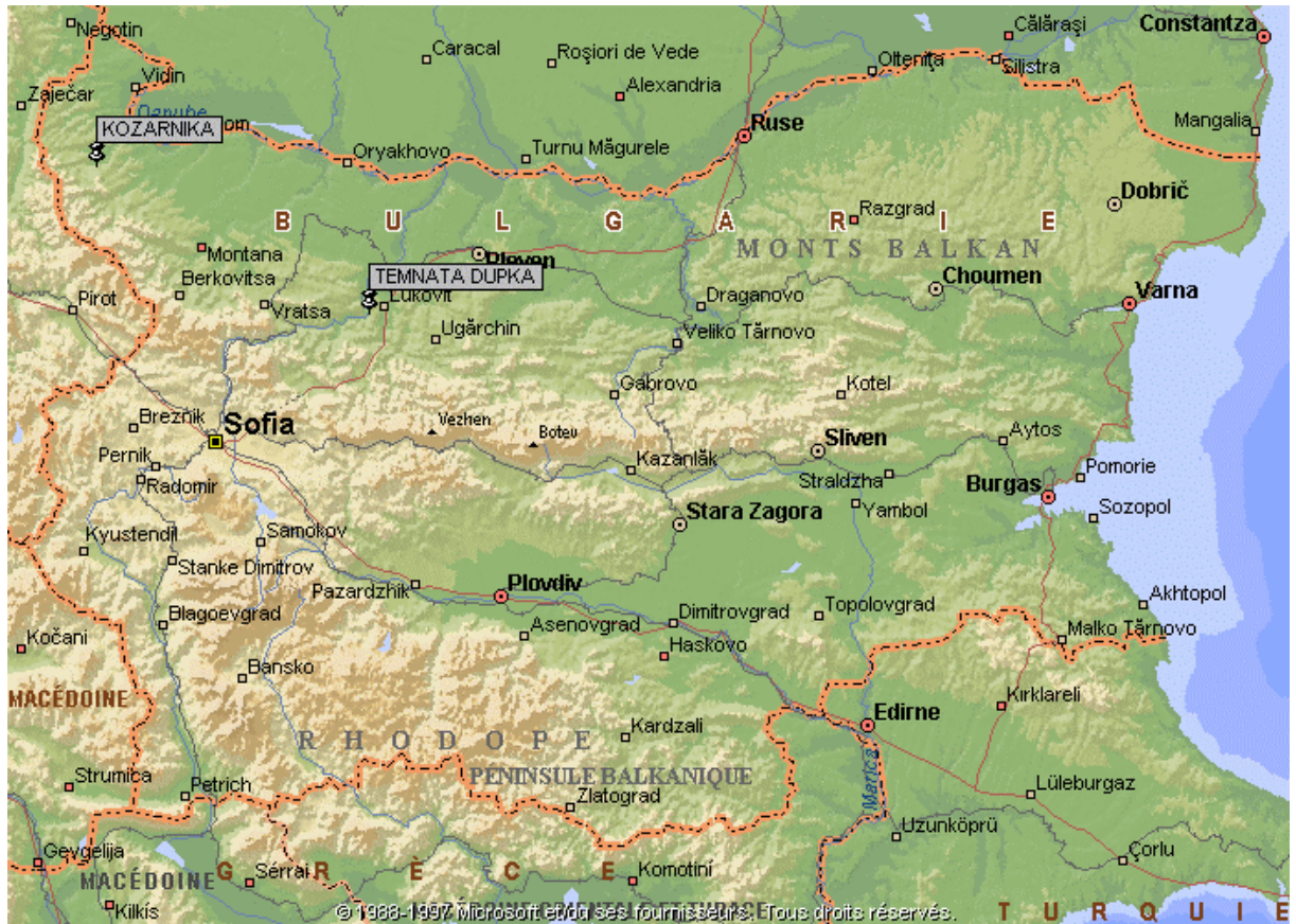
Figure 1 : Localisation des grottes Kozarnika et Temnata Dupka. Местонахождение на пещерите Козарника и Темната дупка