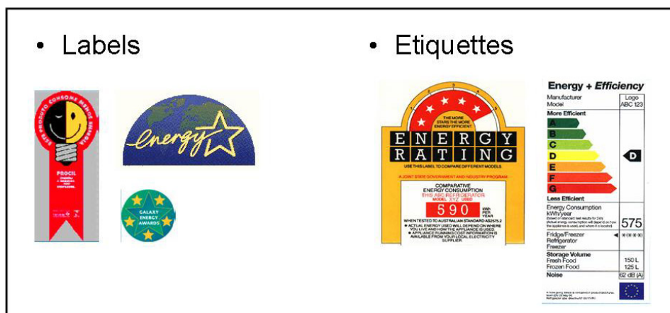
Tableau 1 : Exemples de labels et étiquettes Energie

L'étiquette énergétique ("comparison label") permet de comparer entre elles les performances énergétiques de tous les produits dans une catégorie donnée (réfrigérateurs/congérateurs, sèche-linge, lave-linge, etc) : ex EnergyGuide aux USA ou l'étiquette Energie en Europe. Les labels ("endorsement label") permettent uniquement de distinguer les appareils les plus performants : ex. Energy Star – USA. Les premiers s'appliquent généralement à l'ensemble des produits disponibles, alors que les seconds relèvent d'une démarche volontaire de la part des industriels.