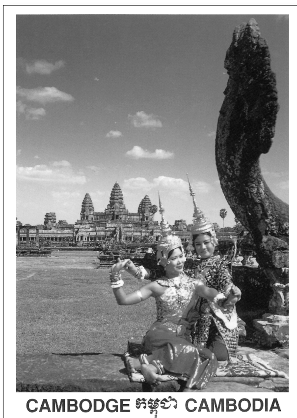
Sur la tête des rois ou des danseuses célestes représentées sur les bas-reliefs d'Angkor, l'on peut admirer des coiffures rappelant l'architecture en gradins des temples angkoriens. On les retrouve sur cette carte postale du Cambodge.

Présenter une bonne image de soi-même consiste, aujourd-