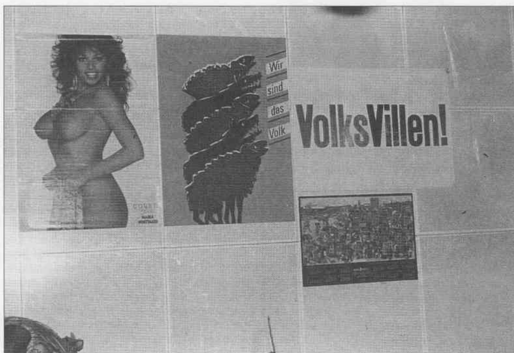
2. Thagell. Décoration murale dans l'atelier de production. « Nous sommes le peuple », « Villas [willen-Volonté] du peuple ».

de Hochhinauf mena d'intenses négociations de coopération avec des partenaires de l'Ouest.