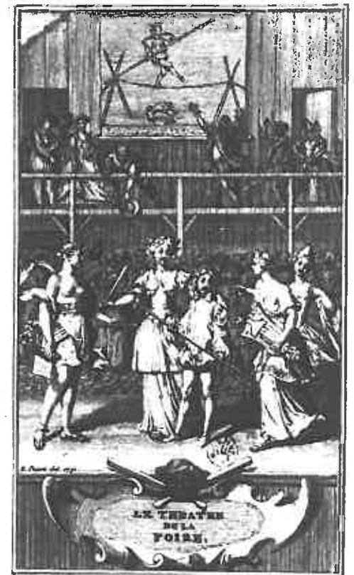
La Muse de la Comédie rassemble la Poésie, la Musique, et la Dance pour composer ses petits divertissements, sous le nom d'Opera Comique.

Cette adoption de la vielle par les femmes de bonne société ne reste pas isolée. Elle s'affirme au contraire dans ces années où le mélange des genres touche d'autres divertissements. Une gravure de Bernard Picart, auteur bien connu des musiciens pour ses élégantes planches pédagogiques des Principes de la flûte de Jacques Hotteterre (1707), apporte une autre image surprenante de nouveauté. Le théâtre de la foire gagne en effet grâce à ce graveur ses lettres de noblesse : « La Muse de la Comédie rassemble la Poésie, la Musique, et la Dance pour composer ses petits divertissements, sous le nom d'Opera Comique ». La musique est habillée d'une robe dont le volant est imprimé d'une portée de musique ; elle arbore l'instrument transfuge, encore sous sa