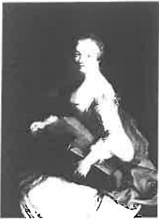
Alexis Grimou, La joueuse de vielle à roue . Huile sur toile, 1728. Localisation actuelle inconnue.