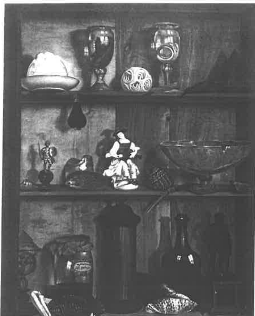
Jean Valette-Penot, Trompe-l'œil à la statue d'Hercule . Huile sur toile, vers 1748. Rennes, Musée des Beaux-Arts.

(1690-1760) d'après un livret de l'abbé Pellegrin, créé à l'Académie Royale le 15 avril 1738. En voici les paroles :