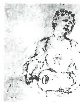
Prince Johann Wilhelm de Saxe-Saalfeld, Jeune fille à la vielle . Dessin tiré de son livre d'esquisses. Avant 1745. Coburg, Kunstsammlungen der Veste.