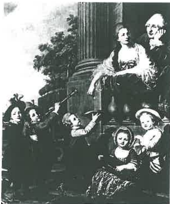
Guillaume Voiriot, La famille Perceval . Huile sur toile. Coll. part.