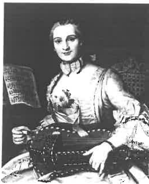
Donat Nonotte, Dame à la vielle . Huile sur toile, 1744. Chaalis, Musée Jacquemart-André.

Or rien n'est plus vrai que la pratique du clavecin est depuis 1690 l'emblème des dames bien éduquées. L'art du portrait en offre un évident témoignage 18 , les compositeurs virtuoses ayant rarement posé devant l'instrument, laissant aux dames le monopole de ces images nombreuses et parfaitement annonciatrices du sujet qui nous occupe ici.