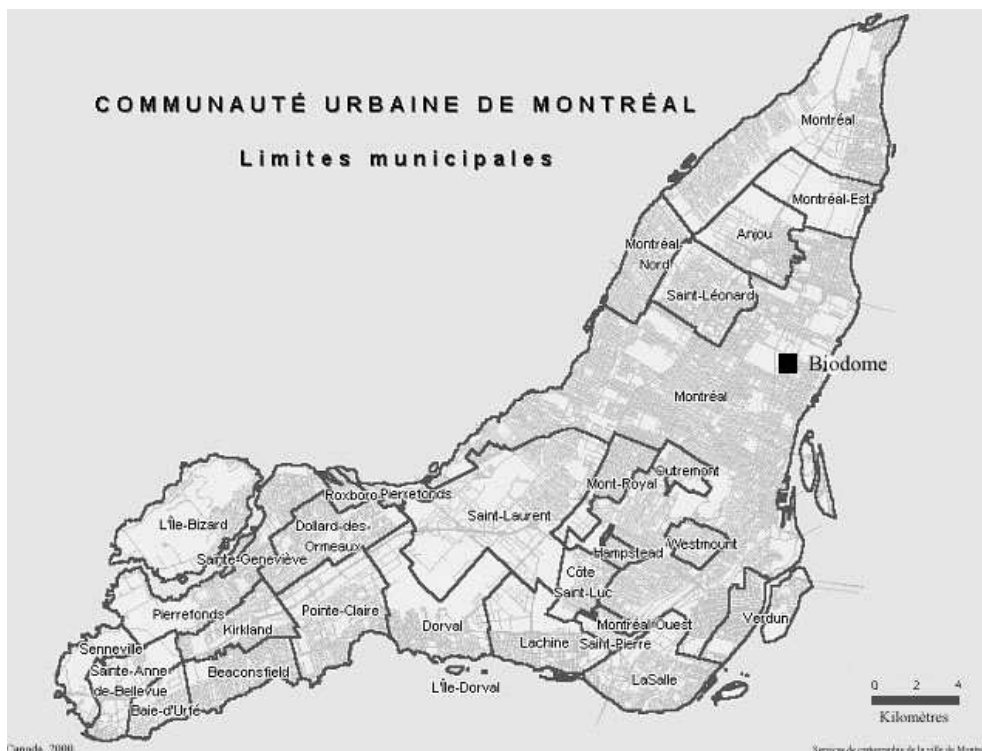
Figure 1 : La C.U.M., 2000, carte des services de la ville de Montréal retouchée par l'auteur

Le bâtiment du Biodôme était à l'origine un vélodrome, construit à l'occasion des Jeux Olympique de Montréal, en 1976. Il fait partie du complexe olympique installé dans le quartier Hochelaga-Maisonneuve, dans l'est de l'île de Montréal. Le choix de l'implantation de l'ensemble dans cette partie de la ville, assez éloigné du centre de la métropole, tenait à une volonté de redynamiser un quartier proche du port et de profiter d'un terrain libre de plus de 55 hectares, longeant la rue Sherbrooke, entre les rues Pie IX et Viau (voir figure 1).