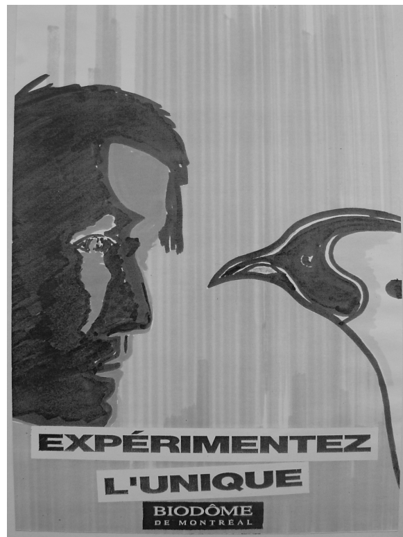
Figure 6 : Publicité pour le Biodôme, printemps 1992

Ce sont bien les animaux qui rendent les écosystèmes intéressants pour les visiteurs : dans chaque milieu il existe une espèce vedette qui lui sert d'icône comme le castor ou les manchots. Le public cherche à entrer en interaction avec eux, en essayant de les toucher, en les pointant du doigt, en les nommant, en essayant d'obtenir leur attention en tapant sur la vitre ou en les appelant. D'autres encore s'essayent à des comportements d'imitation des cris ou des mimiques des animaux. Cela conduit les visiteurs à préférer les animaux actifs : les espaces où les animaux se cachent ou dorment sont ainsi très vite délaissés. Cette recherche de l'interaction et du contact traduit en fait une véritable volonté de confrontation avec l'animalité sauvage, ce que le premier projet de publicité du Biodôme mettait déjà en scène au printemps 1992. On nous présente ici une « expérience » dans laquelle l'homme et l'animal se situent à la même hauteur et se regardent droit dans les yeux dans les yeux, comme pour se jauger (figure 4).