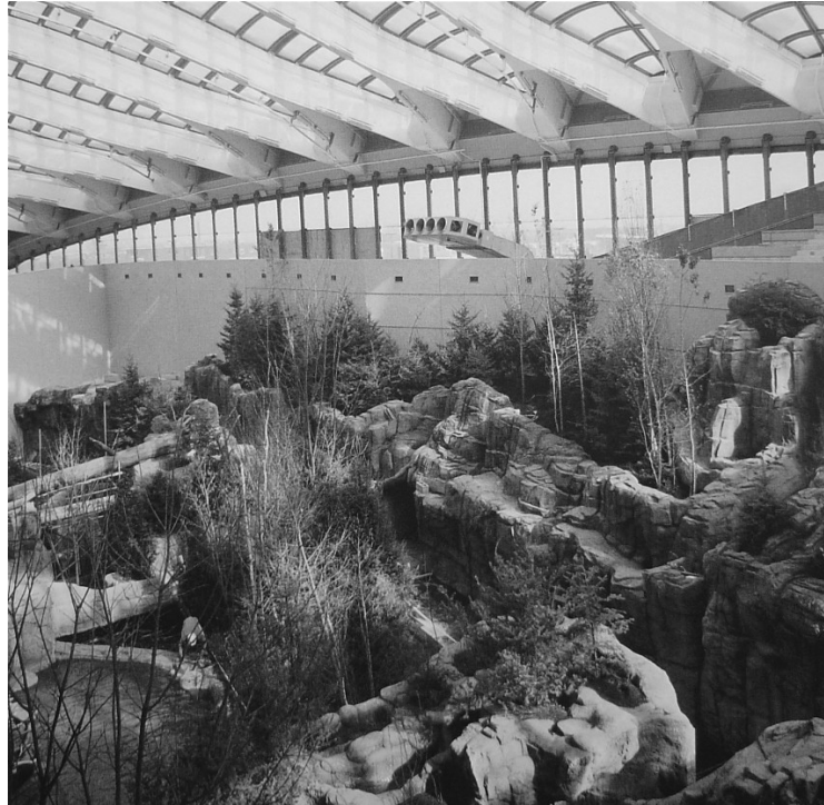
Figure 4 : La forêt laurentienne en préparation, 1992