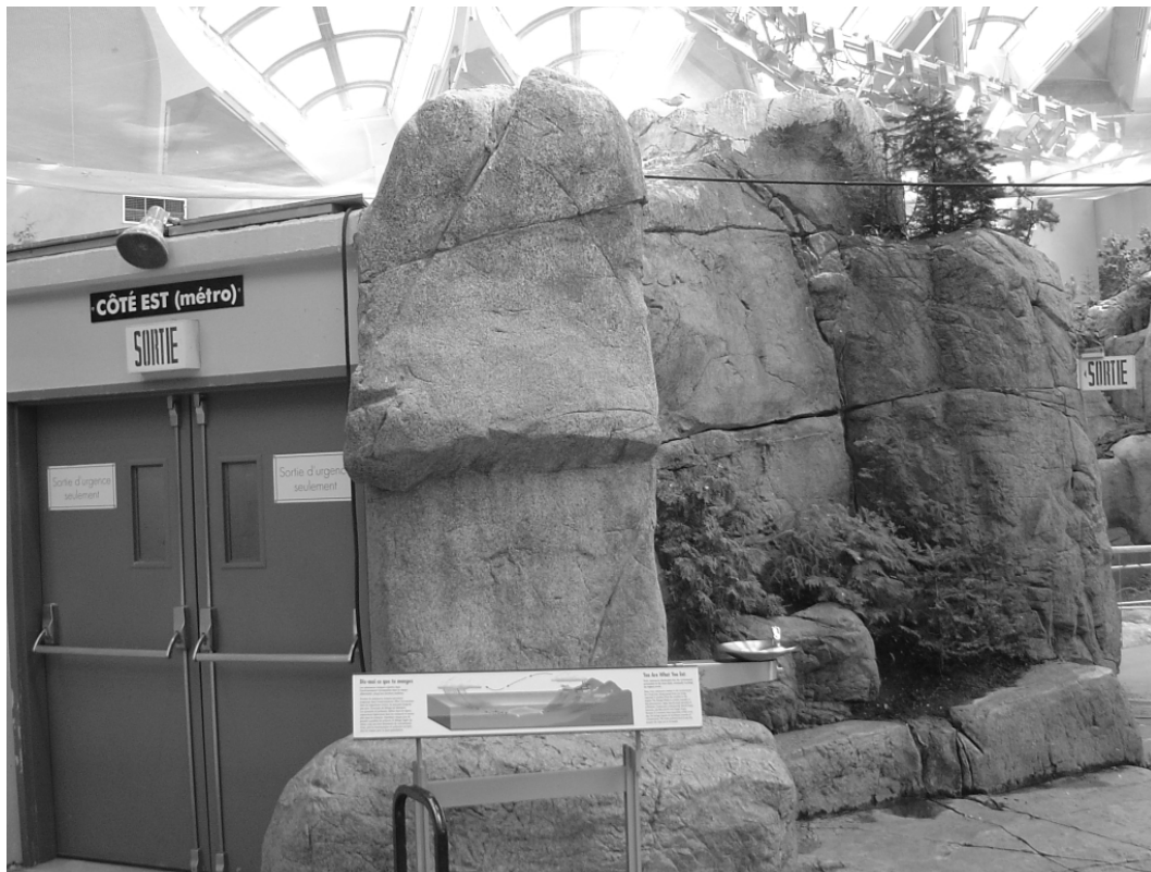
Figure 5 : Dans le Saint-Laurent marin, un espace hybride, 22/03/04

A hybrid space: the Saint-Lawrence seaway