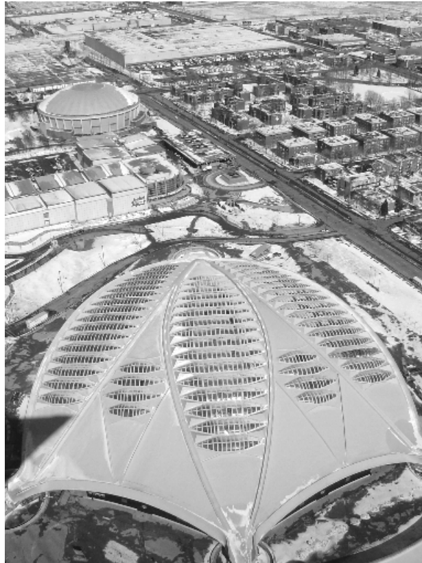
Figure 2 : Le Biodôme vu depuis le mât du stade olympique, 2004

et le jardin zoologique de la ville, totalement dépassés techniquement et dans leur présentation, doivent être rénovés, la ville de Montréal décide de fusionner ces institutions pour créer le Biodôme. Le bâtiment conçu par Roger Taillibert présente quelques avantages majeurs : tout d'abord il se présente comme une sorte de coque en béton précontraint, ce qui limite grandement les déperditions d'énergie et permet également d'avoir une voûte sans appuis intérieurs libérant ainsi une vaste surface à l'intérieur du bâtiment (figure 2). Par ailleurs, la voûte est conçue de telle manière à ce que 60% de sa surface soit percée par des lanterneaux qui assurent le passage de la lumière extérieure ce qui est essentiel si on espère faire croître des espèces végétales.