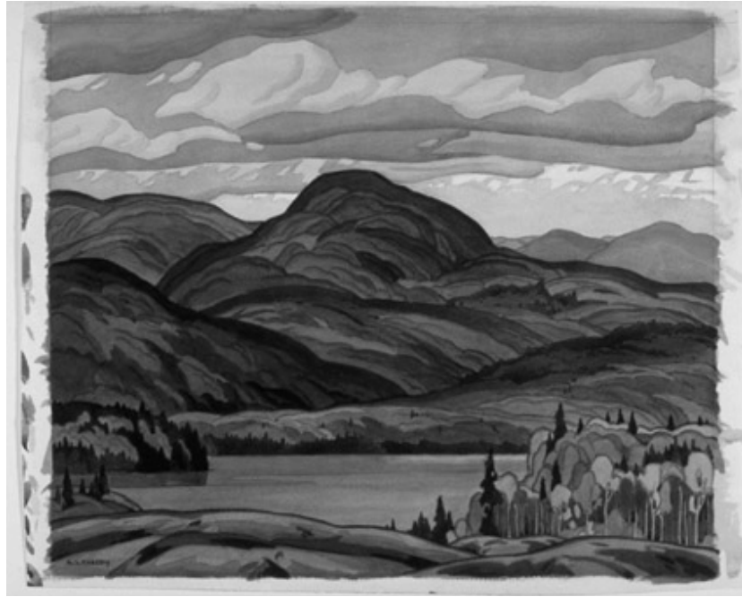
Figure 7 : Casson A. J., 1929, Pike Lake, McMichael Canadian Art Collection

Il faut voir que les travaux du groupe des sept a rencontré un succès notable parmi la nouvelle élite canadienne en formation mais également dans les couches populaires grâce aux nombreuses gravures qui étaient tirées à partir des originaux. Cette représentation du paysage canadien, loin d'être un modèle dépassé, est encore largement réactualisée aujourd'hui, notamment au travers des publicités diffusées dans le Canadian Geographic .