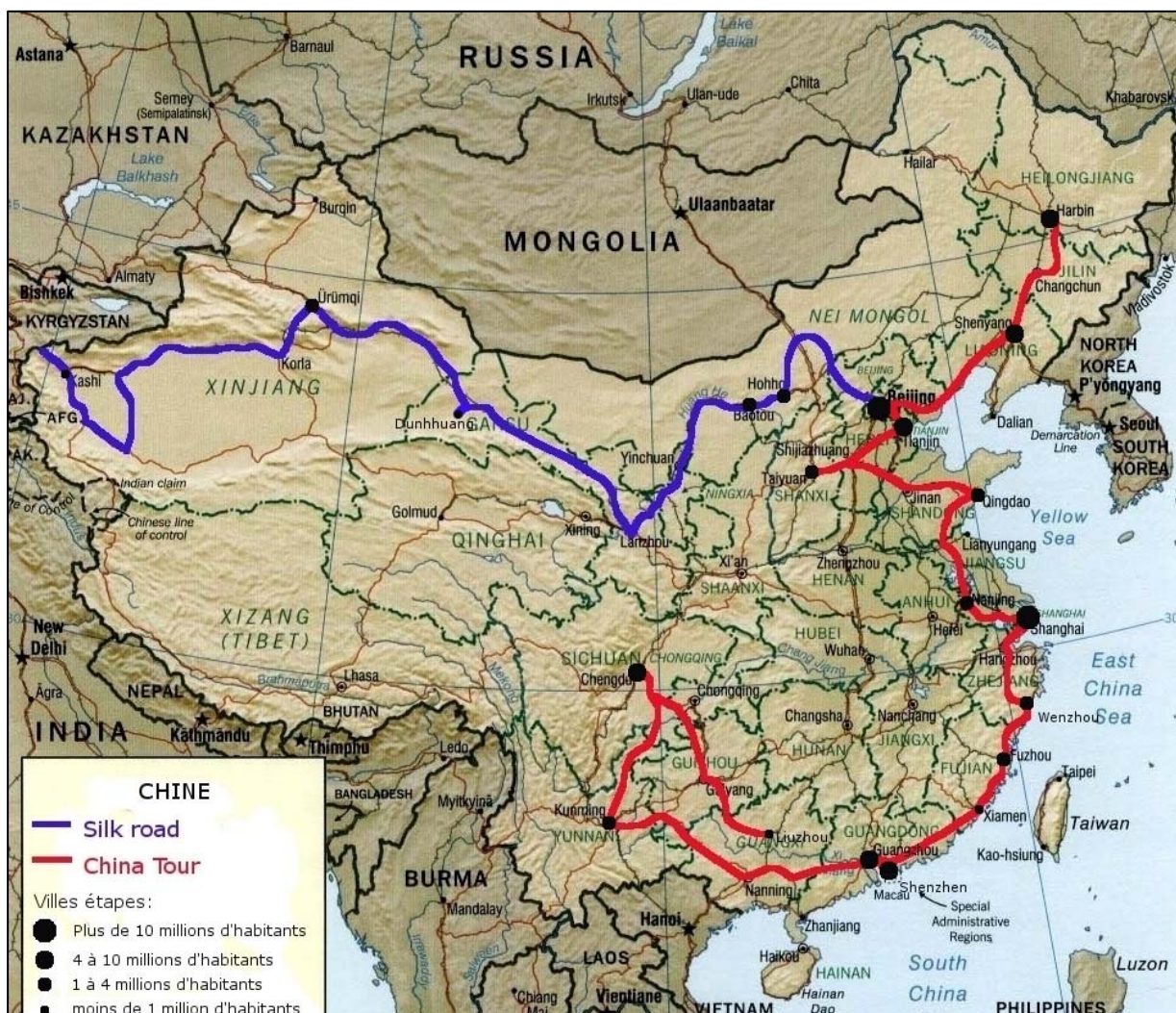
Carte 1 Le parcours de la Silk road et du China Tour de Renault Trucks en Chine

Le but du China Tour était essentiellement de faire connaître la marque qui est encore peu présente en Chine 2 en montrant la gamme commerciale. Il s'agissait également de montrer la fiabilité des véhicules dans les conditions réelles du transport en Chine. Le convoi était alors constitué de l'offre commerciale de Renault Trucks en Chine avec dans l'ordre sur la route : un Midlum (le camion de la gamme légère de Renault Trucks) tracteur 4 essieux sans remorque, un nouveau Magnum (le camion de la gamme lourde de Renault Trucks dont le nouveau modèle était sorti en Mai 2005) tracteur 4 essieux sans remorque, deux Kerax en porteur (un 4 essieux et un 6 essieux) spéciaux provenant de la première partie de la route de la soie, un Kerax route normal (le camion de la gamme construction) en tracteur 4 essieux avec une remorque CIMC (constructeur de remorque chinois partenaire de l'événement) et deux Premium (le camion de la gamme intermédiaire) tracteurs (un 4 essieux et un 6 essieux) également avec des remorques CIMC.