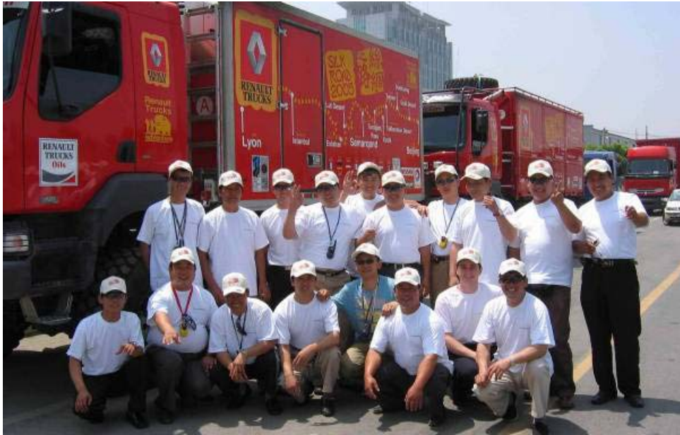
Photo 1 L'équipe du China Tour

L'équipe du China Tour était composée de 16 conducteurs de camions chinois (deux par camions et deux pour conduire la voiture), de 10 personnes employées par une compagnie spécialisée dans l'organisation d'événement publicitaire, qui étaient chargées de mettre en place les structures de l'événement, d'un organisateur employé par la filiale chinoise de Renault Trucks, et d'un sociologue français ! Ainsi, malgré les limitations du nombre de personnes autorisées dans un camion et l'obligation de porter la ceinture de sécurité, nous avons été jusqu'à 5 dans certains camions (pour deux sièges et une couchette). Les chauffeurs étaient des employés d'une compagnie nationale de Shanghai spécialisée dans le transport de containers.