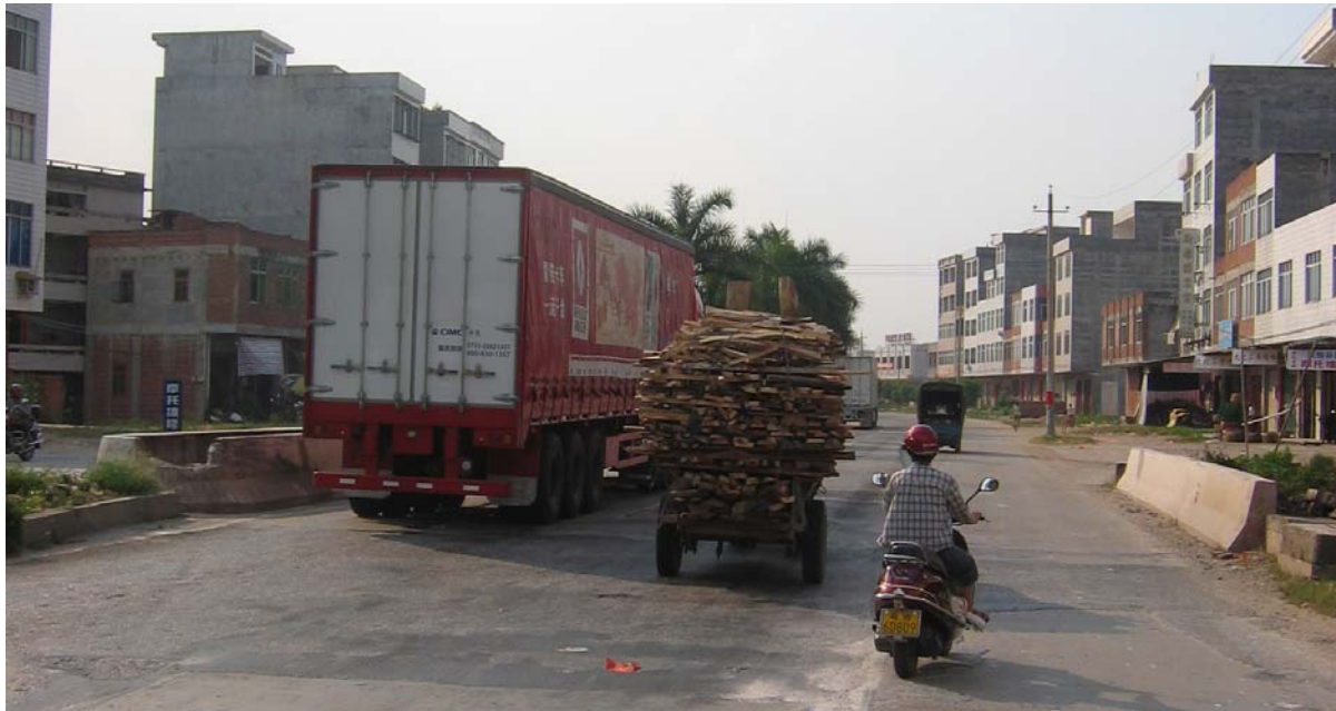
Photo 12. Camion dépassant un tracteur dépassant un scooter sur une route nationale

La distance entre Harbin et Shenyang est de 600 km environ que nous avons parcouru à une moyenne d'environ 60 km/h. Cette moyenne relativement basse s'explique par le fait que les 200 derniers kilomètres d'autoroute étaient fermés pour cause de travaux. Nous avons donc dû emprunter une nationale de niveau très variable. En effet, cette dernière était composée de portions payantes, où la qualité est équivalente à celle de l'autoroute et de portions gratuites parfois plus proches d'une piste de terre. En effet, en Chine, des péages sont souvent mis en place pour financer les travaux routiers et le prix diminue ensuite en fonction de la rentabilisation des équipements. Sur cette nationale, la majorité du trajet étant payante et la route était le plus souvent de bonne qualité. Néanmoins, la vitesse était