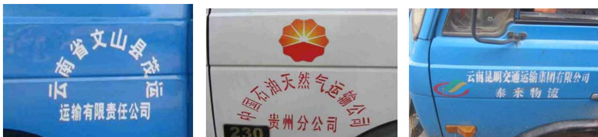
Photo 28 Exemples des logos des entreprises de transport sur les camions

la fierté que le chauffeur retire de son métier et de son véhicule. Tous les chauffeurs rencontrés disent qu'il y a vingt ans, leur métier était valorisant mais qu'aujourd'hui, il s'est banalisé avec la diffusion des véhicules motorisés et la baisse des conditions de vie des chauffeurs. Néanmoins, il semble reprendre de la valeur aux deux extrêmes du développement économique de la Chine. Dans les zones les plus développées économiquement, les entreprises de transport revalorisent les chauffeurs pour des raisons de sécurité, notamment en organisant des formations et en s'imposant des règles en matière de temps de travail. Dans les zones moins développées économiquement, le métier garde sa valeur par la rareté des moyens de transport à moteur, la difficulté et la dangerosité des conditions de travail (routes montagneuses sinueuses et à forte déclivité).