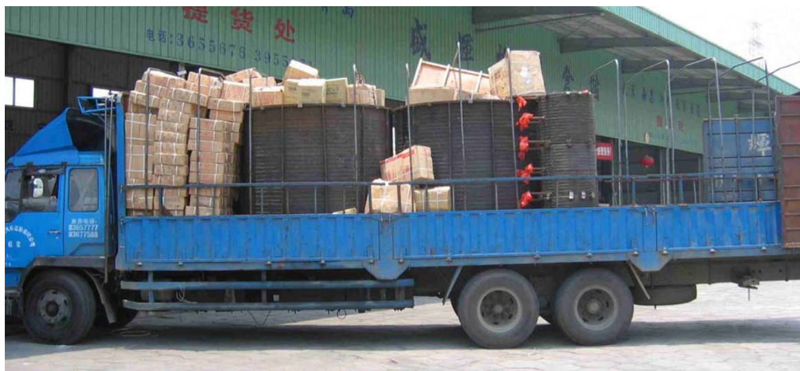
Photo 22 Exemple du chargement typique des camions

d'accès pour ces chariots. A l'intérieur des entrepôts, le déchargement et le chargement se font donc à la main ou grâce à un porte-palette manuel. Les colis encombrants et lourds sont portés par les fenwicks et ne peuvent donc pas être rangés dans les entrepôts. Ils sont alors posés soit au bord des quais, soit à même le sol. Par ailleurs, du fait de la diversité des camions et du manque d'homogénéisation en terme de hauteur de châssis, la hauteur des quais n'est pas adaptée à tous les camions. Il n'y a plus de système de ponts pour s'adapter à la hauteur des camions. Une autre différence majeure est l'absence d'uniformisation des palettes qui permettrait la rationalisation du chargement dans les camions. Enfin, il n'existe pas de système d'échange des palettes. Comme celles-ci ont un coup important, les logisticiens hésitent à les charger dans les camions de peur de ne pas pouvoir les récupérer. Le chargement directement par palette semble dans ce contexte impossible. Enfin, une autre différence est la généralisation des pratiques de transvasement d'un véhicule à l'autre. Pour accélérer le chargement ou déchargement de leurs véhicules, certains chauffeurs transfèrent les marchandises directement en rapprochant les caisses des deux camions. Cette pratique est interdite en