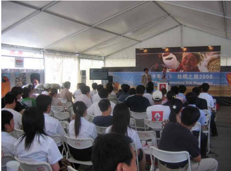
Photo 9 Présentation durant un événement

Par la suite, le responsable des ventes dans la zone Nord-Est de la Chine a présenté l'offre produit de Renault Trucks en insistant sur le multipositionnement de Renault Trucks dont l'étendue de la gamme vise à répondre à l'ensemble des besoins de transport.