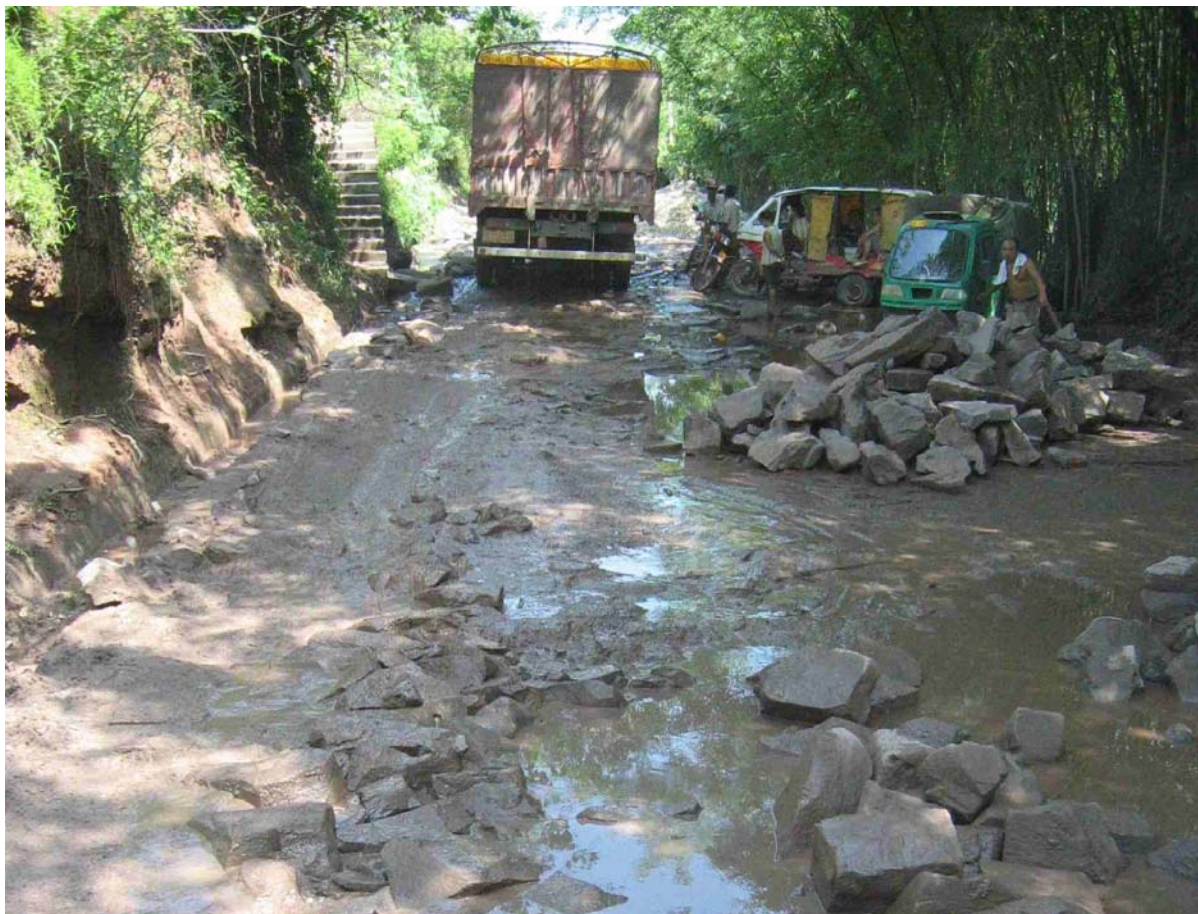
Photo 34 Les effets de la saison des pluies et de la surcharge des camions sur la route nationale après Dagan

A noter qu'il existe une autre autoroute reliant ces deux villes, qui est une partie de l'axe Pékin-Xian-Chengdu-Kunming, dont la construction est plus avancée. Néanmoins, comme cette route alternative traverse une zone militaire, les organisateurs ont préféré ne pas l'emprunter car la caravane