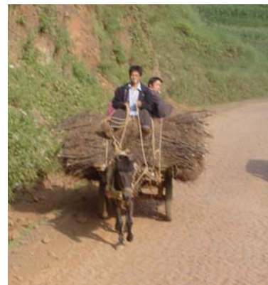
Photo 24 Trois exemples de transport dans les régions rurales

En ce qui concerne l'état des routes nationales, il est encore une fois extrêmement hétérogène. Jusqu'à Fulin, dans la province du Guangxi, où nous passons la première nuit, c'est une route bétonnée de bonne qualité. A partir de cette ville débute l'autoroute menant à Naning. Après cette dernière, la route nationale alterne entre des portions mises à neuf et d'autres en terre ou en béton mal entretenu. A noter que sur une portion de cette route nationale, l'autoroute est en cours de construction. Nous devons alors emprunter une piste parallèle pendant 70 km que nous parcourons en 6h. En effet, nous traversons une montagne percée de multiples carrières où circulent de nombreux camions : ceux qui ont été détournés et ceux qui exploitent les carrières. Il est difficile de les croiser étant donné