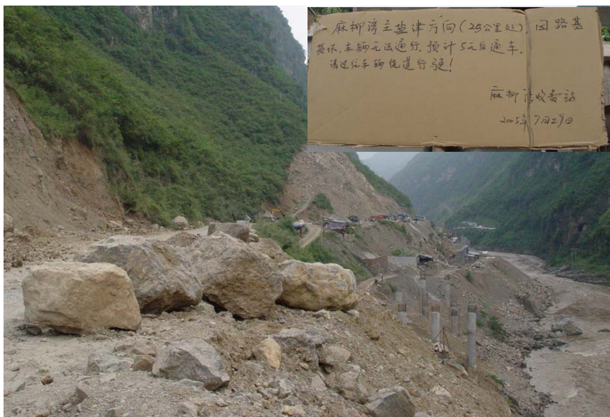
Photo 31 Les travaux à Daguang et la seule indication (25 km avant) annonçant la fermeture de la route pour 5 jours