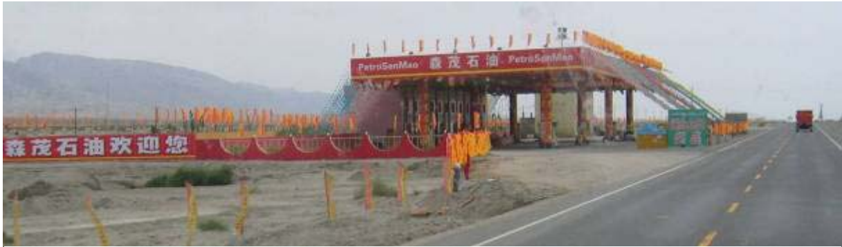
Photo 15 Une station essence dans le nord-ouest de la Chine: 12 pompes pour un trafic pourtant très faible

Sur la portion de route qui nous permet de relier Tianjin à partir de l'autoroute entre Pékin et Shanhaiguan, la circulation est presque nulle. Cette autoroute moderne et en bon état n'est pas la route la plus directe entre Pékin et Tianjin, ce qui explique sa faible fréquentation mais pointe du doigt l'inadéquation entre le réseau autoroutier et les besoins du secteur des transports. Il est souvent frappant de voir le contraste entre la modernité des infrastructures ainsi que leur échelle et la faiblesse du trafic, les transporteurs étant sans doute découragés par les prix.