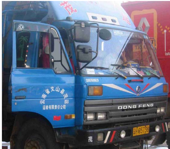
Photo 29 Exemple de camion décoré dans le sud de la Chine

Dans ces régions du sud de la Chine, la proportion des marques change radicalement : FAW est à peu près à égalité avec Dongfeng (environ 25% des véhicules). De plus, la proportion de camions est marquée par le grand nombre de Chenlong et Balong, marques également produites par Dongfeng, à l'usine de Liuzhou située dans la province du Guangxi que nous traversons. Alors que ces camions sont pratiquement absents des autres provinces, ils représentent environ 30% du trafic dans la province du Guangxi et 10% dans les provinces avoisinantes. Ces caractéristiques mettent en exergue le fort régionalisme des ventes de camion en Chine.