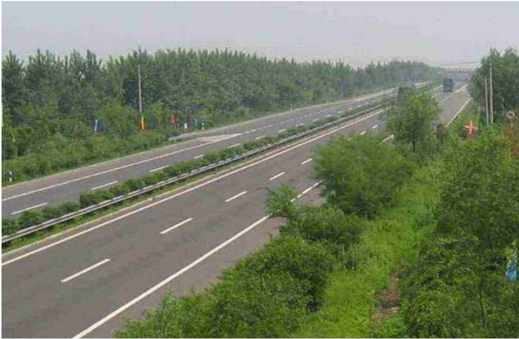
Photo 3. Un exemple d'autoroute dans le Nord-Est de la Chine

La deuxième portion de route traverse les provinces du Liaoning, Jilin et Heilongjiang, c'est-à-dire la plaine de Mandchourie, qui constituent le Nord-Est du pays. Ces provinces sont une des importantes réserves minières et agricoles de la Chine. Il n'y existe qu'un seul axe autoroutier Nord-Sud qui relie les capitales de ces trois provinces à Pékin (cf. carte 2). Les régions que nous traversons alors sont beaucoup plus agricoles et les villes plus espacées. Cette autoroute est caractéristique des premières construites en Chine : à deux fois deux voies avec de bonnes infrastructures, elles sont actuellement dans un mauvais état faute d'entretien et à cause de la surcharge des véhicules. C'est ce qui explique la baisse de notre moyenne kilométrique (65 km/h le dimanche contre 75km/h le samedi). Nous sommes toujours sur une autoroute avec deux voies dans chaque direction mais le revêtement est en mauvais état. De plus, de larges portions de voies sont fermées à la circulation pour causes de travaux. Le trafic y est faible et les véhicules qui l'empruntent sont essentiellement destinés au transport de biens ou de personnes.