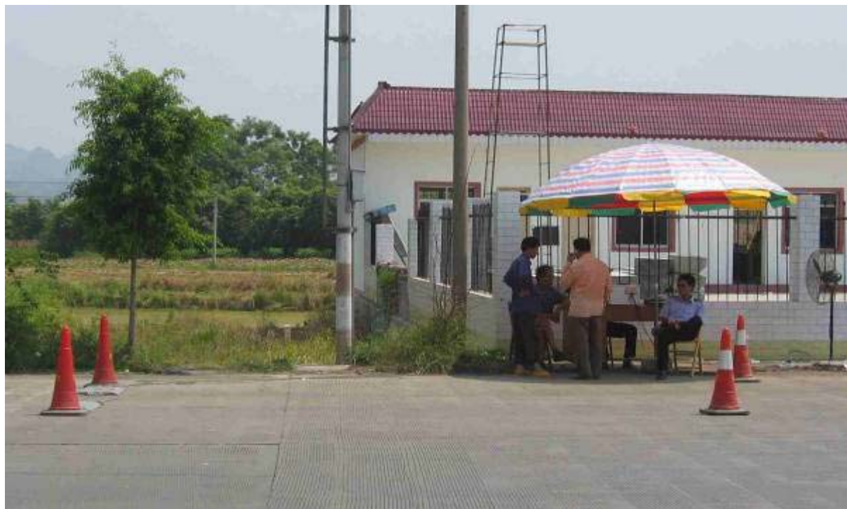
Photo 13 Un point de contrôle de poids mobile

Il semble donc que la politique du gouvernement ait échoué à mettre en place des limitations sur le poids transporté. Par ailleurs, les effets pervers de cette loi ont entraîné encore plus de contraintes sur le transport de marchandise puisque les transporteurs doivent satisfaire à plus de pots-de-vin. Aujourd'hui, à partir des observations sur les routes, il est clair que les camions surchargés restent la norme (cf. Photo 14).