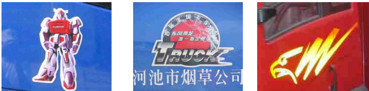
Photo 27 Exemples de stickers des constructeurs : l'automan de Foton, un sigle de l'usine DF à Liuzhou et l'aigle de FAW

En Chine, le camion semble plus appartenir aux constructeurs qu'au transporteur qui en est pourtant propriétaire. En effet, il existe peu de coloris pour les camions (tous les anciens camions chinois étaient bleus, aujourd'hui chaque marque à une couleur qui lui est fortement associée), sur les camions sont collés les stickers des constructeurs, le nom de l'entreprise n'est que peu visible (il est en général seulement peint sur la portière des véhicules), les entreprises n'ont pas de logos. De même, les chauffeurs réalisent peu de transformation sur leur véhicule. Dans la plupart des régions de Chine, les chauffeurs ajoutent seulement des amulettes au rétroviseur et ne font que quelques adaptations liés au confort (notamment en ajoutant des nattes sur les sièges). Au fur et à mesure que l'on entre dans les terres, les camions sont de plus en plus décorés par leurs propriétaires ou utilisateurs. Les entreprises de transport ont des logos, certains font même peindre leurs carrosseries (comme Honghe un fabricant de cigarette qui effectue l'ensemble de son transport). Les chauffeurs font également plus de modifications, ils collent notamment beaucoup de stickers représentant des drapeaux rouges, des animaux ou des paysages. Il est intéressant de relier ces décorations avec la valorisation du métier de chauffeur routier. En effet, on peut faire l'hypothèse que les décorations des véhicules sont le signe de