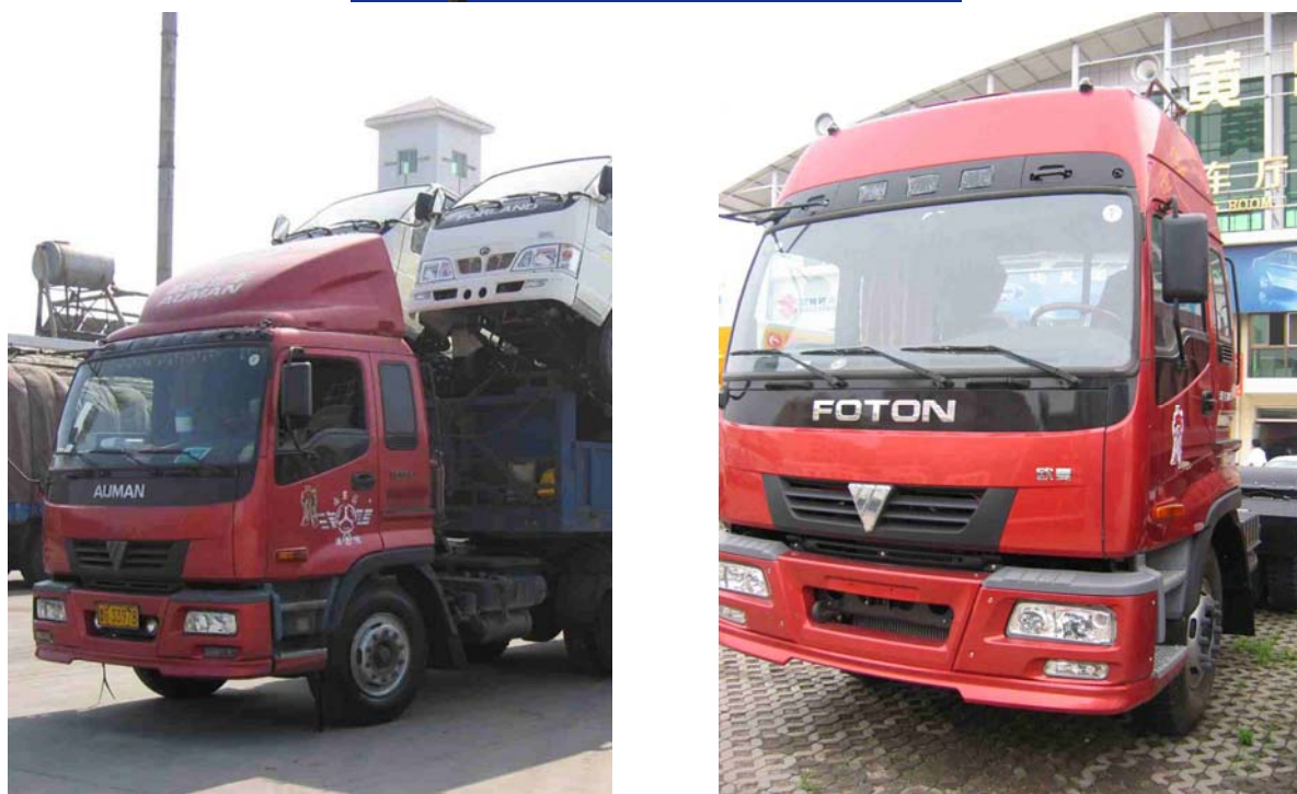
Photo 7 Deux versions du Auman, le camion de la gamme lourde de Foton