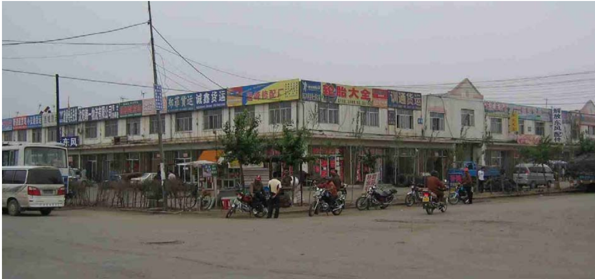
Photo 17 Les agences logistiques

L'offre de transport en Chine est marquée par le clivage entre les entreprises de transport et les indépendants dans un contexte de surcapacité. Même s'il existe de grandes entreprises de transport (par exemple Sinotrans possède 30 000 camions), le marché semble dominé par un grand nombre de petites entreprises et d'indépendants. Ainsi, selon les statistiques du gouvernement, la moyenne est de 2,7 camions par entreprise de transport routier. En raison de cette forte concurrence, les chauffeurs attendent en moyenne environ 3 jours pour avoir une marchandise sur ce parking. De même, le prix du transport est de manière générale bas. Sur ce parking et celui que nous avons visité à Shenyang, il est fixé autour de 0,3 yuans par tonne kilomètre pour un aller simple et jusqu'à 0,16 pour un aller-retour. Sur cette somme, les chauffeurs doivent payer tous les frais de route (gasoil, péage et entretien du véhicule), la marge gardée par l'agence étant uniquement des frais de management. Sur ce parking, le niveau de vie et les conditions de travail semblent être encore inférieurs à ceux des chauffeurs transportant du minerai de fer à Qingdao même s'il existe une hiérarchie au sein des indépendants reposant notamment sur la capacité de chargement de leur camion. Visiter un parking d'indépendants permet en ce sens de comprendre pourquoi les chauffeurs chinois semblent plus effrayés du « manque de travail » que du « trop de travail ».