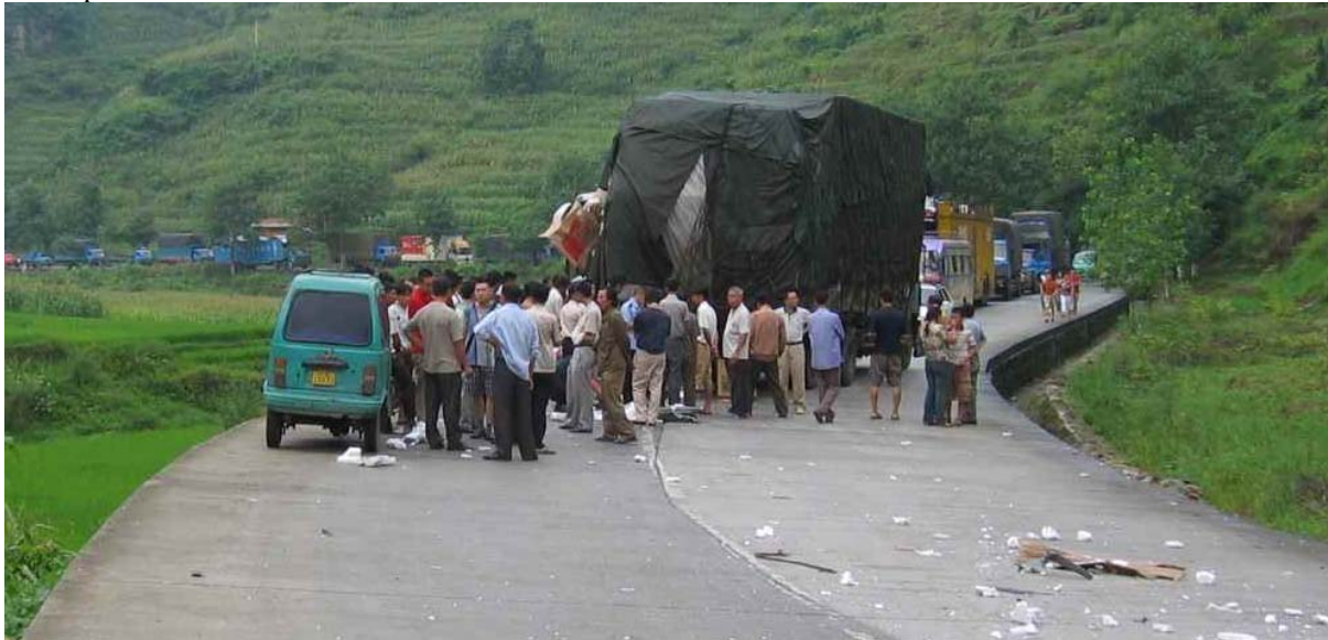
Photo 16 Attroupement consécutif à un accident sur une route surélevée dans la province du Guangxi

perte d'adhérence du fait de l'état des pneumatiques et de la route. Ces deux éléments sont particulièrement critiques en temps de pluie. Le deuxième accident montre les risques de sur-accidents lié principalement à la lenteur du dégagement des véhicules de la zone d'accident. Les accidents créent de larges attroupement de spectateurs (même sur l'autoroute) qui bloquent les voies et augmentent le risque. Cet aspect est renforcé par le mode de résolution conflits liés aux accidents. En effet, lorsque les deux parties impliquées n'arrivent pas à trouver d'accord concernant les responsabilités de l'accident, les véhicules sont laissés dans la même disposition pour que la police puisse déterminer qui est coupable à partir de l'emplacement des véhicules les uns par rapport aux autres. Durant notre trajet, les accidents ont été la cause la plus récurrente d'embouteillages. Enfin, le troisième cas d'accident pointe une des caractéristiques des routes chinoises qui sont souvent construites en hauteur par rapport au sol et ont donc d'importants fossés. Les routes étant généralement étroites, le risque de versement est important.