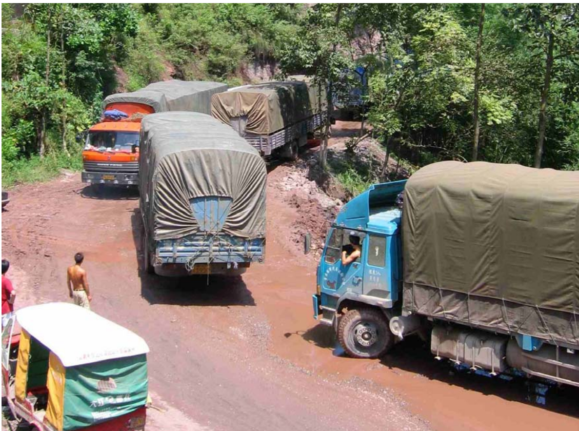
Photo 33 Difficulté de croisement sur la route nationale après Daguan