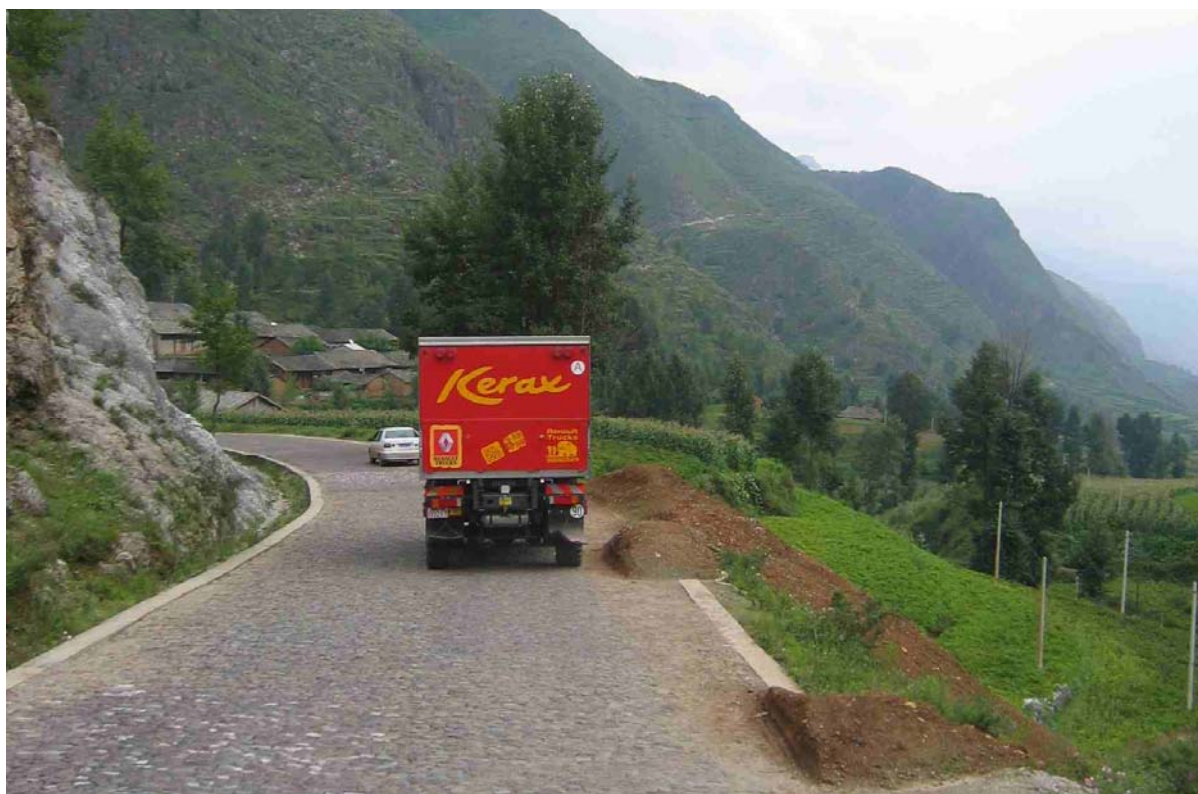
Photo 30 La route nationale pavée après Kunming