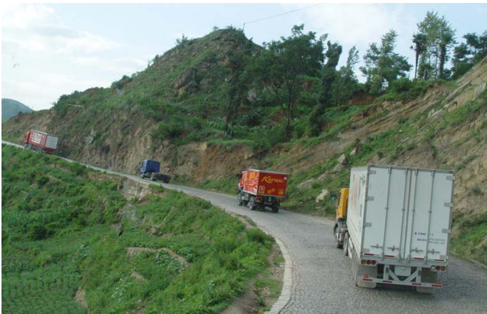
Photo 2 Quatre des sept camions utilisés pour le China Tour

L'équipe du China Tour était composée de 16 conducteurs de camions chinois (deux par camions et deux pour conduire la voiture), de 10 personnes employées par une compagnie spécialisée dans l'organisation d'événement publicitaire, qui étaient chargées de mettre en place les structures de l'événement, d'un organisateur employé par la filiale chinoise de Renault Trucks, et d'un sociologue français ! Ainsi, malgré les limitations du nombre de personnes autorisées dans un camion et l'obligation de porter la ceinture de sécurité, nous avons été jusqu'à 5 dans certains camions (pour deux sièges et une couchette). Les chauffeurs étaient des employés d'une compagnie nationale de Shanghai spécialisée dans le transport de containers.