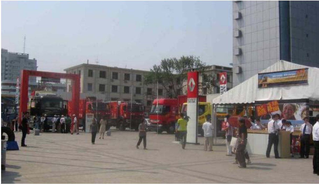
Photo 8 Exemple d'un événement

La nuit du samedi au dimanche a été passée sur une aire d'autoroute aux alentours de Shenyang. Les conditions des hôtels destinés aux chauffeurs routiers permettent d'appréhender leur niveau de vie. Ces hôtels sont à la fois peu chers (5 yuans 17 la chambre pour deux personnes et le repas est d'un prix équivalent) et d'un standing bas (notamment en ce qui concerne le confort et la propreté). Ces prix sont néanmoins supérieurs à ceux qui sont proposés dans les hôtels au bord des routes nationales et s'adressent aux chauffeurs les plus aisés. En fait, la plupart des chauffeurs préfèrent garder l'argent que leur donne leur patron et dormir dans leur camion.