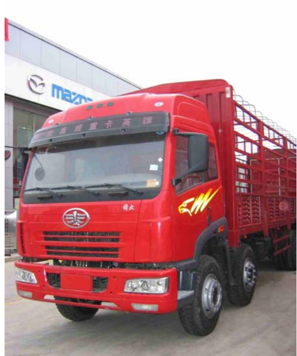
Photo 4 Les camions de la gamme lourde de FAW: le plus courant et le nouveau modèle