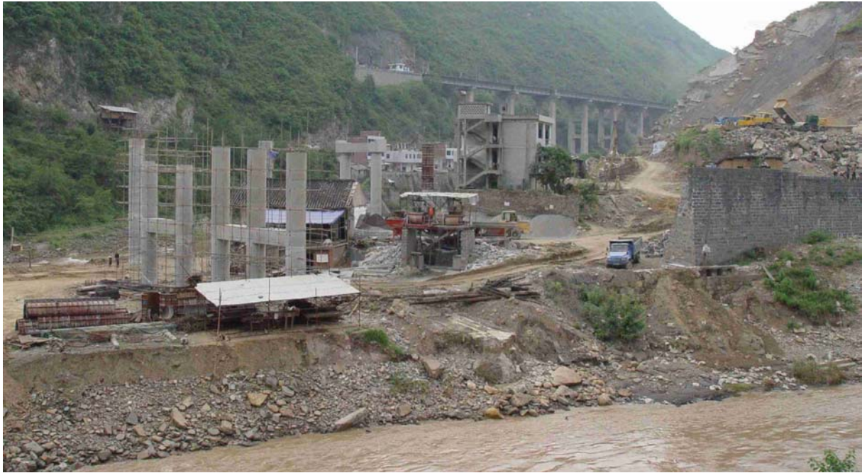
Photo 19 Construction d'une nouvelle autoroute dans la vallée du fleuve Ou Jiang

Le trafic est important jusqu'à Hangzhou. Après cette ville, il diminue fortement. La proportion de camion Dongfeng reste stable même si FAW reste leader sur tout le trajet. A noter que pendant ce trajet, nous croisons les premiers camions Chenlong et Balong, les deux "marques" produites par l'usine de Dongfeng à Liuzhou.