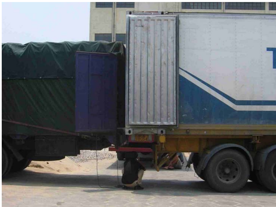
Photo 21 Transvasement entre deux camions

d'accès pour ces chariots. A l'intérieur des entrepôts, le déchargement et le chargement se font donc à la main ou grâce à un porte-palette manuel. Les colis encombrants et lourds sont portés par les fenwicks et ne peuvent donc pas être rangés dans les entrepôts. Ils sont alors posés soit au bord des quais, soit à même le sol. Par ailleurs, du fait de la diversité des camions et du manque d'homogénéisation en terme de hauteur de châssis, la hauteur des quais n'est pas adaptée à tous les camions. Il n'y a plus de système de ponts pour s'adapter à la hauteur des camions. Une autre différence majeure est l'absence d'uniformisation des palettes qui permettrait la rationalisation du chargement dans les camions. Enfin, il n'existe pas de système d'échange des palettes. Comme celles-ci ont un coup important, les logisticiens hésitent à les charger dans les camions de peur de ne pas pouvoir les récupérer. Le chargement directement par palette semble dans ce contexte impossible. Enfin, une autre différence est la généralisation des pratiques de transvasement d'un véhicule à l'autre. Pour accélérer le chargement ou déchargement de leurs véhicules, certains chauffeurs transfèrent les marchandises directement en rapprochant les caisses des deux camions. Cette pratique est interdite en