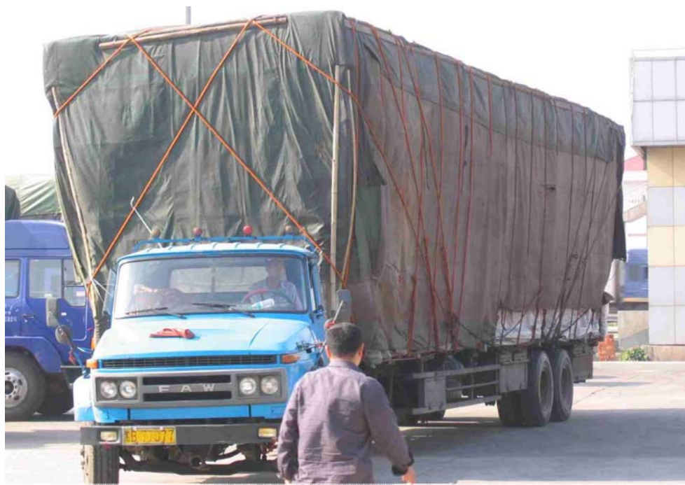
Photo 14 Les camions surchargés restent la norme

Il semble donc que la politique du gouvernement ait échoué à mettre en place des limitations sur le poids transporté. Par ailleurs, les effets pervers de cette loi ont entraîné encore plus de contraintes sur le transport de marchandise puisque les transporteurs doivent satisfaire à plus de pots-de-vin. Aujourd'hui, à partir des observations sur les routes, il est clair que les camions surchargés restent la norme (cf. Photo 14).