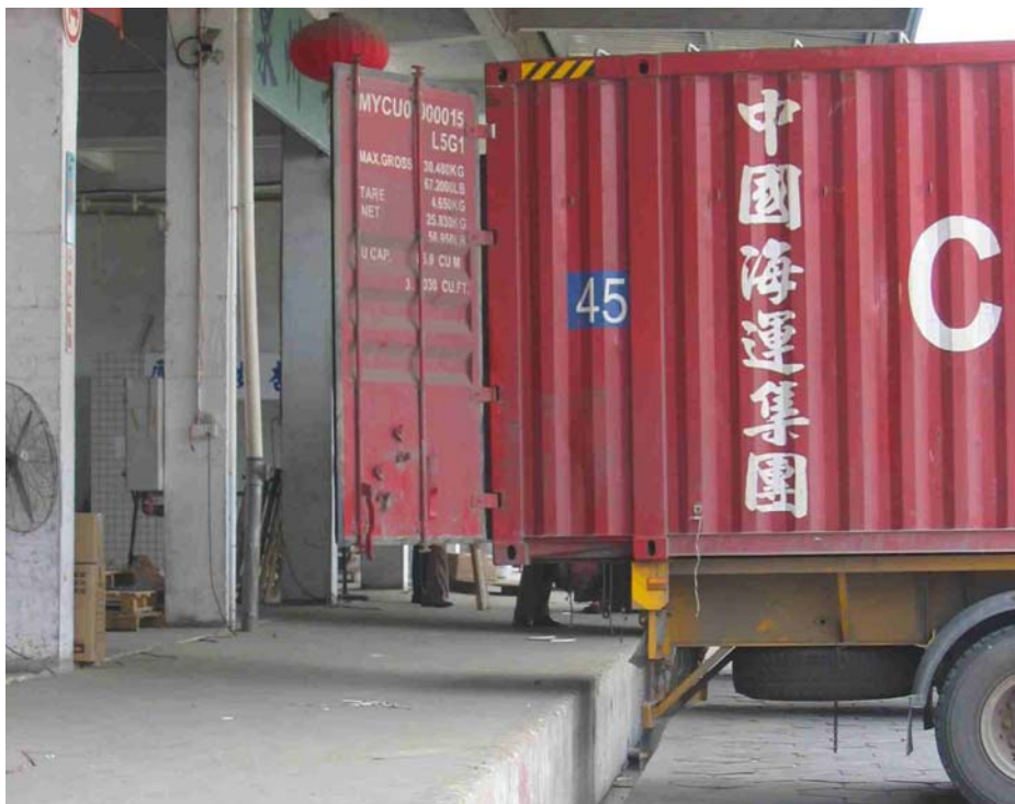
Photo 20 L'inadéquation entre la hauteur des quais et du châssis du camion

A Fuzhou, nous avons réalisé deux entretiens dans des entreprises de transport. Le premier a eu lieu au sein d'une entreprise de transport et de logistique qui possède 600 camions (dont 15 camions européens et 50 véhicules japonais) avec le responsable du management de la flotte. L'entreprise possède 120 entrepôts et bureaux dans le pays. Le prix du transport est bas même s'il reste supérieur à celui des indépendants : environ 0,4 yuan par kilomètre et par tonne. Après l'entretien, nous avons réalisé une visite des cinq entrepôts de l'entreprise à Fuzhou qui nous a permis de mesurer les différences dans l'organisation de la logistique entre la Chine et l'Europe même si l'exemple de cette grande entreprise n'est pas généralisable. Le site est pourvu de 4 fenwicks mais ils ne peuvent pas être utilisés pour la plus grande partie du travail. En effet, les entrepôts sont en hauteur et il n'existe pas