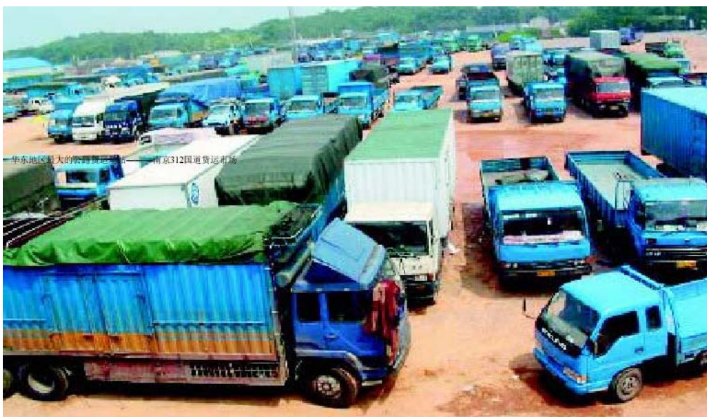
Photo 18 Un exemple de parking d'indépendants

L'offre de transport en Chine est marquée par le clivage entre les entreprises de transport et les indépendants dans un contexte de surcapacité. Même s'il existe de grandes entreprises de transport (par exemple Sinotrans possède 30 000 camions), le marché semble dominé par un grand nombre de petites entreprises et d'indépendants. Ainsi, selon les statistiques du gouvernement, la moyenne est de 2,7 camions par entreprise de transport routier. En raison de cette forte concurrence, les chauffeurs attendent en moyenne environ 3 jours pour avoir une marchandise sur ce parking. De même, le prix du transport est de manière générale bas. Sur ce parking et celui que nous avons visité à Shenyang, il est fixé autour de 0,3 yuans par tonne kilomètre pour un aller simple et jusqu'à 0,16 pour un aller-retour. Sur cette somme, les chauffeurs doivent payer tous les frais de route (gasoil, péage et entretien du véhicule), la marge gardée par l'agence étant uniquement des frais de management. Sur ce parking, le niveau de vie et les conditions de travail semblent être encore inférieurs à ceux des chauffeurs transportant du minerai de fer à Qingdao même s'il existe une hiérarchie au sein des indépendants reposant notamment sur la capacité de chargement de leur camion. Visiter un parking d'indépendants permet en ce sens de comprendre pourquoi les chauffeurs chinois semblent plus effrayés du « manque de travail » que du « trop de travail ».