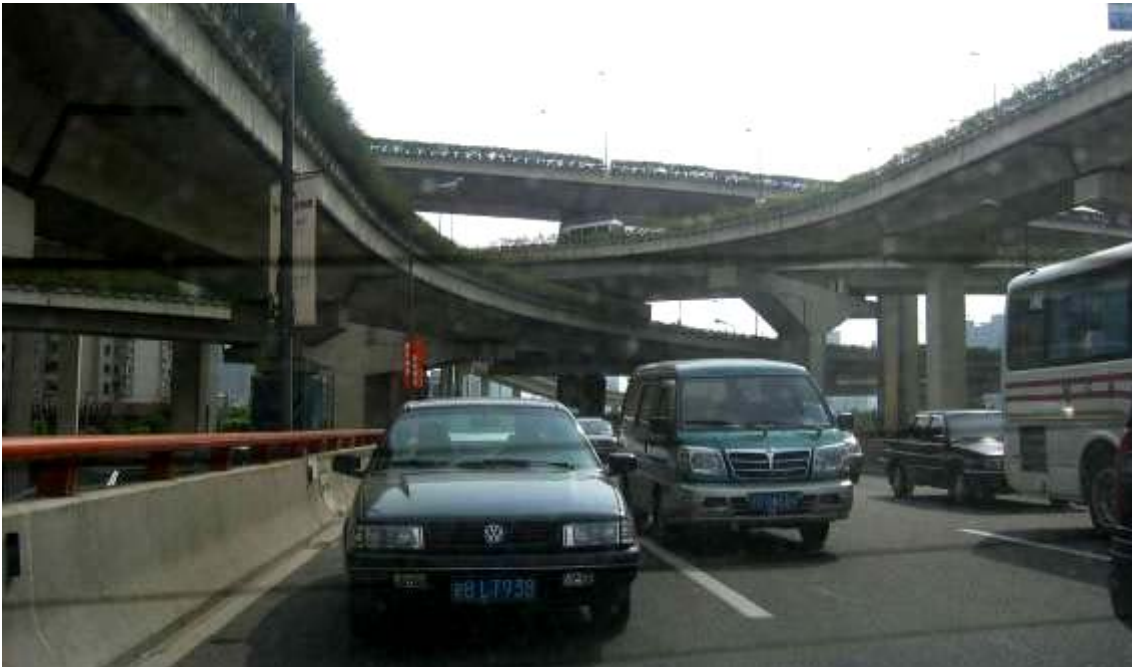
Photo 11 Un exemple du trafic sur un boulevard périphérique à 5 niveaux dans une grande ville chinoise (Shanghai)

Harbin étant une ville de 4,6 millions d'habitants, la sortie de la ville fut difficile. En effet, il y a beaucoup de trafic dans les villes et les indications ne sont pas adaptées aux voyages de longue distance. Dans les villes en Chine, les panneaux indiquent généralement seulement le nom des rues environnantes. A ces difficultés, s'ajoute le fait que les cartes ne sont pas toujours fiables en raison de la forte variabilité des conditions routières. Dès lors, le moyen le plus commode pour s'orienter est de se référer aux personnes originaires de la région. Ainsi, pour toutes les autres villes étapes de notre voyage, nous serons accompagnés du vendeur ou d'un employé du concessionnaire. Il est symptomatique que la caravane n'ait jamais eu de carte des villes et que les seules cartes du réseau d'autoroute aient été achetées pendant le trajet. Par ailleurs, le trafic dans les villes souffre de plus en plus de problèmes de congestion du fait de la croissance importante de l'automobile dans le pays, malgré la vitesse de construction de nouvelles infrastructures et en particulier des périphériques.