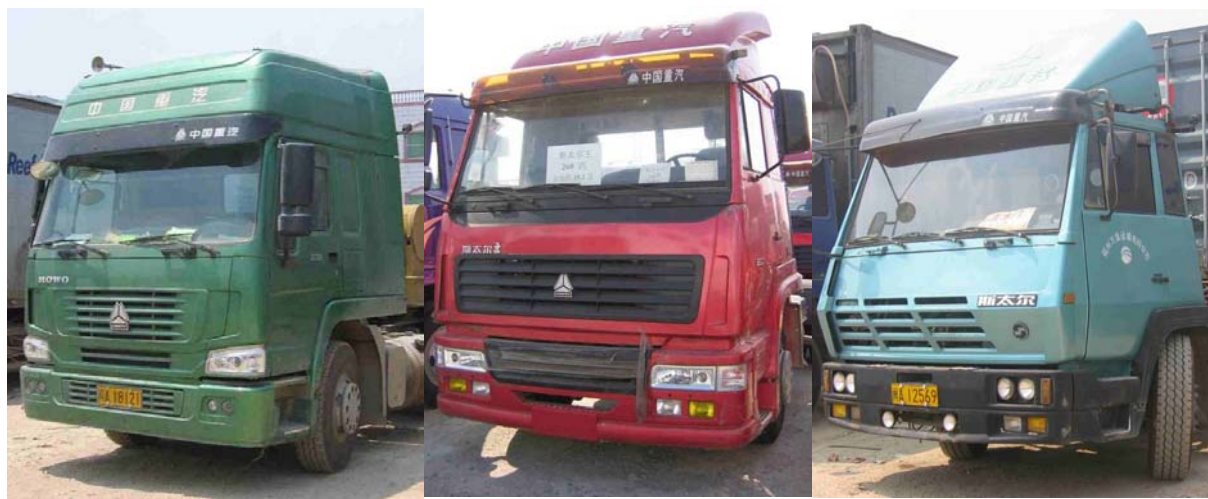
Photo 6 Les trois modèles de la gamme lourde de CNHTC