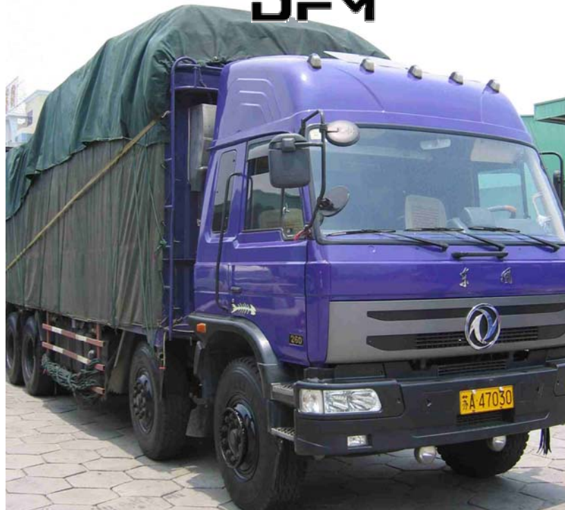
Photo 5 Le nouveau camion de la gamme lourde Dongfeng