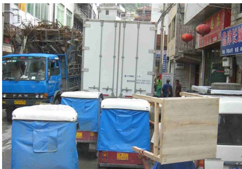
Photo 26 Exemple de difficulté lors de la traversée des villes

Sur ce trajet, la majorité des camions que l'on croise sont des porteurs avec une cabine à capot, équipés de bennes en raison du grand nombre de carrière. Pourtant, alors que l'état de la route devient de plus en plus mauvais, les camions de gamme haute sont plus décorés et semblent mieux entretenus. La rupture est d'autant plus importante que les camions destinés au transport local sont souvent vieux