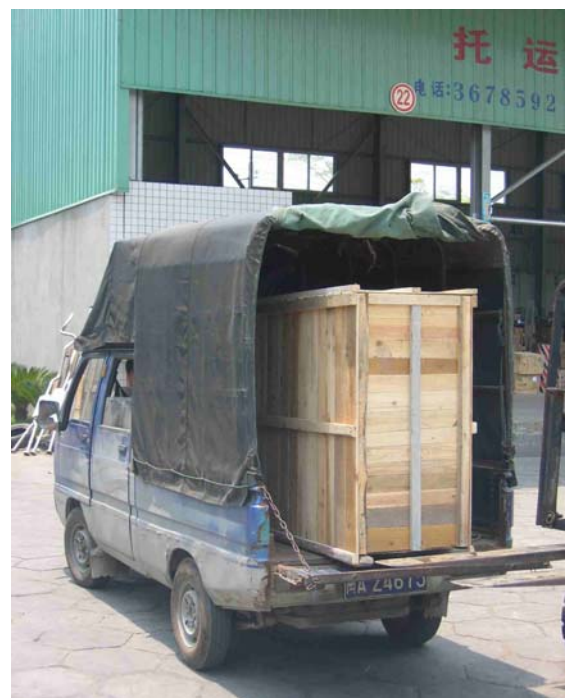
Photo 23 Quatre photos qui illustrent un exemple de transvasement entre deux véhicules impliquant deux fenwicks et 6 personnes