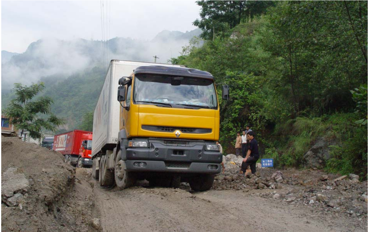
Photo 32 Route nationale après Daguan