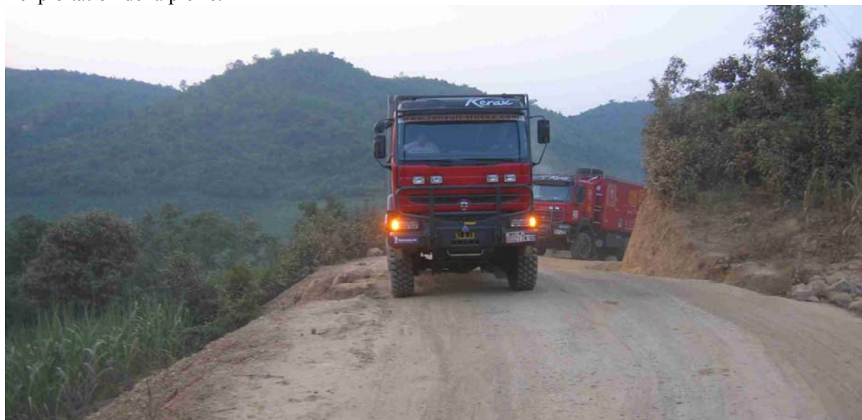
Photo 25 Piste empruntée après Nanning dans la province du Guangxi

l'étroitesse de la piste, ce qui crée de nombreux encombrements. De plus, nous sommes ralentis par les semi-remorques qui ont du mal à gravir certaines côtes à cause de la poussière générée par l'exploitation de la pierre.