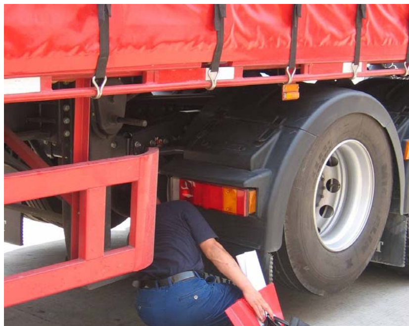
Photo 10 Le châssis en premier

Les transporteurs ont ensuite été invités à découvrir les camions avec les commentaires des vendeurs, du concessionnaire et des employés de la filiale présents. Certains ont pu les essayer lorsque qu'ils possédaient un permis poids-lourd. Il est intéressant de constater que, sans doute en raison des pratiques de surcharge, le première aspect du camion que regardent les transporteurs est la capacité de résistance du châssis.