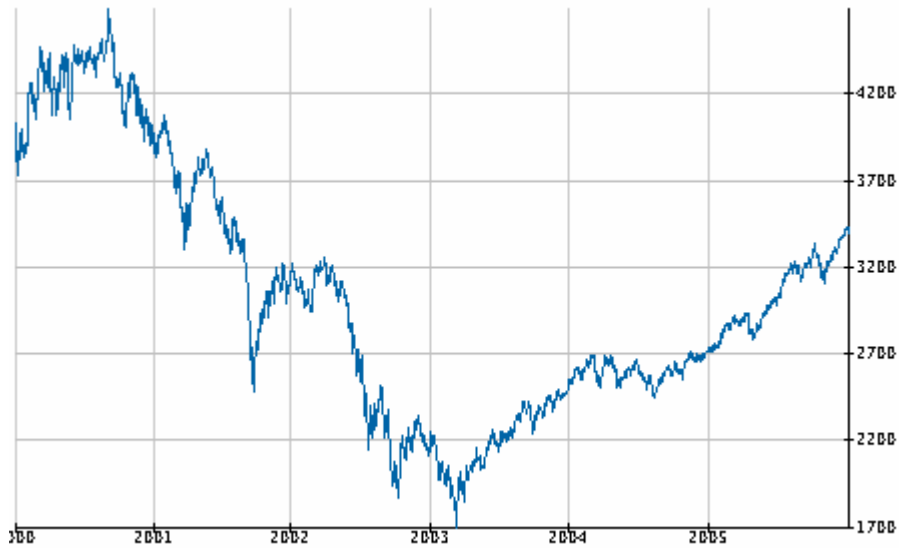
Figure 1 : Evolution de l'indice SBF 120