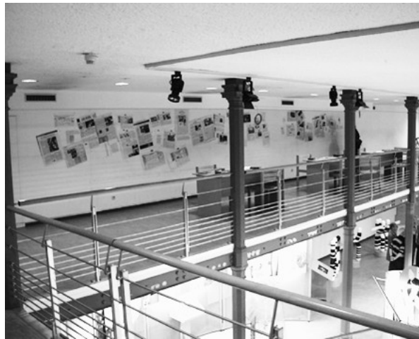
Figure 1 : La mezzanine de l'exposition « Focus on genes »

proprement dite. D'authentiques journaux, très nombreux, tapissent le mur d'entrée, certains passages d'articles ayant été préalablement surlignées. Des magazines, ouvrages et prospectus sont disponibles sur des tables devant lesquelles on peut s'asseoir. Les visiteurs peuvent donc lire des journaux dans un espace qui n'est pas celui de la visite, mais celui d'une pratique documentaire de consultation studieuse.