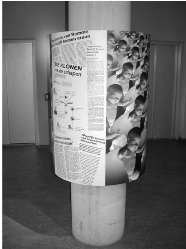
Figure 3 : un « vrac d'images » médiatiques autour d'une colonne, au NEMO

Ces figures du discours à propos de science, qu'on retrouve associées à d'autres thèmes et dans d'autres contextes (actualité, cinéma, etc.), constituent des citations qui témoignent de la conscience explicite de l'existence d'un champ médiatique, d'une sorte de culture commune des médias. A la télévision 8 comme dans les expositions, ce type d'autoréférence ou de citation, apparaît dans la période contemporaine (les années 1990).