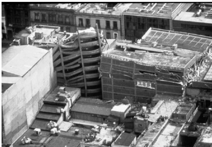
Photo - Séisme de 1985 à Mexico : effondrement vertical d'un immeuble

légitimité du régime et au début de la fin d'une hégémonie de plus de 50 ans du PRI sur la vie politique mexicaine.