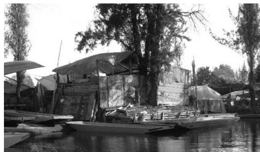
Photo – Invasion urbaine dans les chinampas de Xochimilco (F. Mancebo, 2003).

Cette urbanoculture a longtemps permis de valoriser des ressources sous-utilisées : main-d'œuvre, espace, terrains. Elle contribue à réduire la pauvreté en procurant à ses populations urbaines une meilleure alimentation et un revenu plus élevé grâce à des emplois directs et indirects : tourisme, distribution des produits, etc. Elle réduit le coût de la collecte, du traitement et de l'élimination des déchets : possibilité de transformer des déchets humains en compost, et d'utiliser les eaux usées domestiques. L'instauration de périmètres de protection interdisant toute exploitation de ces espaces est évidemment inacceptable par les Xochimilquiens.