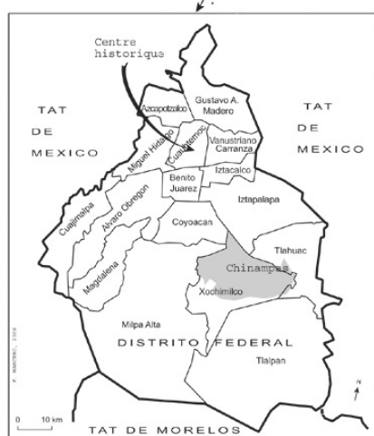
Figure 1. Mexico et le District Fédéral.

Par ailleurs, l'ensemble se trouve dans une cuvette, sur une zone humide entourée de montagnes. Originellement l'eau de pluie et de la fonte des neiges s'écoulaient en provenance des montagnes voisines vers le bassin de Mexico, puis s'infiltrait dans le sol pour alimenter des aquifères très superficiels. Depuis son assèchement, cet espace est soumis à l'alternance d'inondations dévastatrices et de longues périodes de sécheresse amplifiées par une gestion de l'eau calamiteuse. De nombreux effets indirects en résultent. Ainsi, l'assèchement ancien de ces zones humides contribue à intensifier la pollution aérienne en favorisant le maintien des particules en suspension. En 1988, lorsque le lac Texcoco a été partiellement réalimenté par les effluents de la ville, les concentrations de polluants dans l'air ont immédiatement chuté sur l'ensemble de l'agglomération.