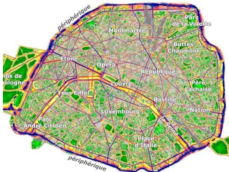
Cartes 2D et 3D du bruit routier parisien, mise en ligne sur internet 15