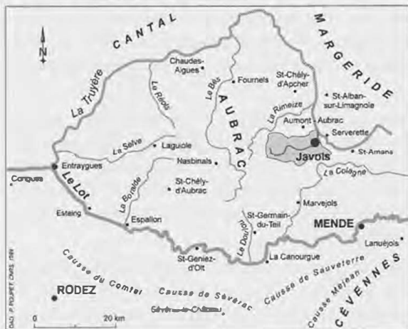
Fig. 1. Localisation du bassin versant du Triboulin et de Javols/ Anderitum dans l'hydrosystème entre Aubrac, Margeride, Cantal, Cévennes et Causses.

Situé dans le département de la Lozère (région du Languedoc-Roussillon), là où se rencontrent les reliefs granitiques de la Margeride et ceux des formations volcaniques de l'Aubrac, Javols est aujourd'hui un village à l'habitat dispersé dans une vallée où coule une paisible rivière, le Triboulin (fig. 1). L'altitude du bassin versant est élevée, entre 1 200 et 900 m, la région de Javols constituant un