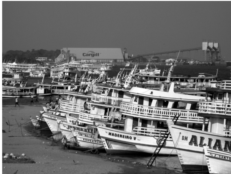
Le port de Santarém (Pará), au fond le port céréalier de la Cargill. JPR préfère les bateaux traditionnels, il est ici accroupi à la proue de l'un d'entre eux

de traitement du manioc, puis méditer à voix haute sur toutes les expérimentations que les agriculteurs amazoniens avaient dû réaliser avant d'arriver à cette maîtrise de la plante et de ses usages fut un régal. Et suivre avec lui les échanges de plantes introduits par les Grandes Découvertes (maïs, pomme de terre, tomate et manioc du Nouveau Monde contre café, canne à sucre et blé du Vieux Monde) nous aida grandement à supporter les cahots de la Transamazonienne, puis de la BR163, jusqu'à Santarém.