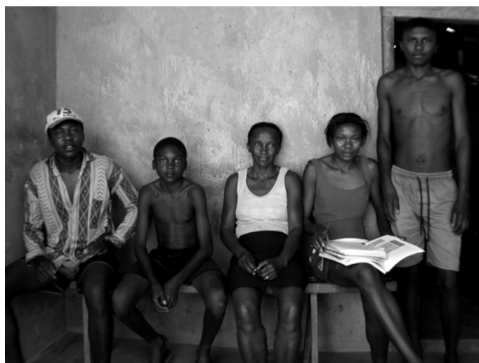
À Acauã (Piauí), une famille de petits agriculteurs dans un ancien quilombo , village-refuge d'esclaves « marrons »

Le lendemain, 6 septembre, était consacré au travail des agronomes de l'Embrapa, à la fois en remerciement du prêt de la voiture qui nous permettrait de traverser le Piauí et parce que nous avons jugé qu'il intéresserait JPR. Ce fut effectivement le cas : il apprécia à sa juste valeur l'innovation des « barrages souterrains » destinés à stocker l'eau des rares périodes pluvieuses, astucieuse et peu coûteuse puisque les paysans peuvent la réaliser en barrant les rivières intermittentes d'une digue de terre recouverte d'une feuille de plastique normalement destinée aux serres. L'eau des crues passe sans peine la diguette, mais une partie de l'eau reste dans les alluvions meubles, piégée par la feuille de plastique à l'abri de l'évaporation. Et il suivit avec une grande attention la démonstration de l'agronome qui a découvert un moyen d'accroître le taux de germination de l' umbuzeiro , un des rares arbres fruitiers qui prospère malgré la sécheresse. Celui-ci avait observé les jeunes pousses qui pointaient dans les parcs à chèvres, à partir de noyaux rejetés par les animaux, et conclu qu'il fallait utiliser leurs déjections dans la pépinière pour déclencher la germination. « Un agronome observateur et qui n'hésite pas à mettre les mains dans la merde pour améliorer le sort des paysans, ça me va », résuma JPR le soir devant une bière fraîche, bien méritée après une journée en plein soleil.