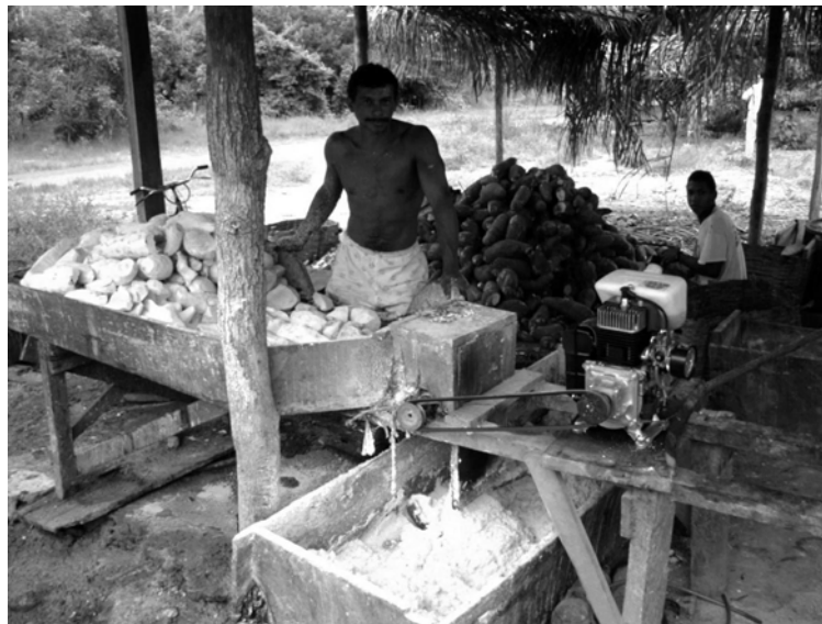
Casa de farinha à Uruará (Pará), où l'on prépare la farine de manioc

Cette fois le dépaysement était complet pour les paysages, les plantes cultivées, l'échelle des phénomènes, et JPR regardait de tous ses yeux et nous bombardait de questions, parfois faciles et parfois beaucoup moins, tirées de parallèles avec ses références malgaches et africaines. Ce fut notamment le cas quand il nous demanda ce que les colons faisaient de leurs morts, une question que nous nous étions jamais posée, mais qui était centrale pour les colons malgaches qui entreprenaient de longs voyages afin de ramener les dépouilles sur la terre de leurs ancêtres. La stupeur des colons nordestins à qui nous avons alors demandé s'ils envisageraient de faire de même nous confirma que nous avions mis à jour, grâce à JPR, une différence majeure dans les comportements et les visions du monde d'un continent à l'autre, les uns gardant le contact avec le passé et la terre natale alors que les autres tournaient résolument la page. Mais ce fut son tour d'être surpris, voire choqué, quand ils laissèrent paraître que le riz n'était pas pour eux une plante très intéressante, tout juste bonne à nettoyer le terrain la première année après le défrichage.