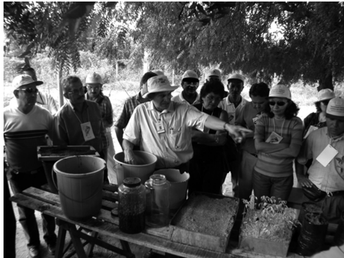
À l'Embrapa de Petrolina, démonstration sur la germination de l' umbuzeiro . JPR écoute avec attention : on le reconnaît à l'arrière-plan, au-dessus de l'épaule gauche de l'agronome

l'irrigation goutte-à-goutte) et de sols (vierges), ce qui était bon pour le raisin de table, mais moins pour le vin.