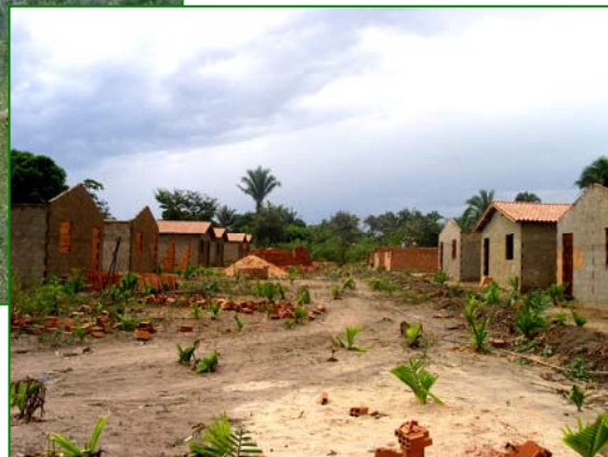
Vila Nova, à Ciriaco, érigée en quelques mois, illustre la nouvelle urbanité de la deuxième génération.

Au village, le boom de la construction des maisons est notable, il correspond d'une part à la facilité d'acquisition de lots urbains dans le territoire de la vila , soit 17,5 ha d'aire résidentielle ( Relatório técnico , CNPT/MMA/G.F Consultores, 2002), d'autre part à la possibilité d'obtention du crédit habitation (Pronaf/A attribué par l'INCRA aux membres de la Resex, maisons standardisées, 6x8 mètres, en briques, avec sanitaires