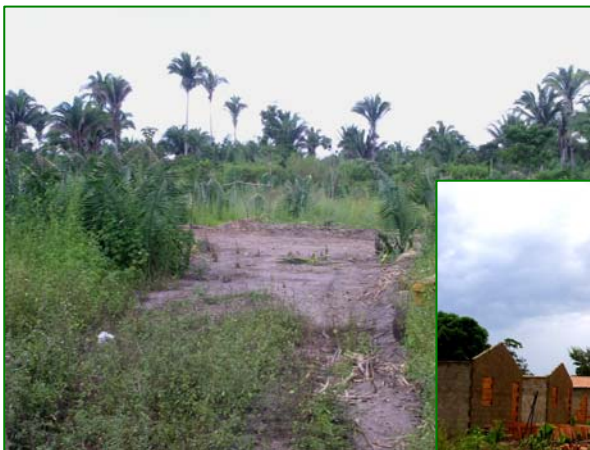
« Avant », en mars 2006, (à gauche) et « après », en août 2007 (à droite)

La population qui s'était d'abord fixée en plusieurs hameaux, a tendance à se concentrer dans le plus important d'entre eux, Vila Ciriaco, devenu le bourg-centre de référence de la communauté. Flanqué des vilas Fiquene et Bigode,, il abrite une centaine d'habitations, un poste de santé, une école, un poste téléphonique et d'autres équipements communautaires. Les hameaux Alto Bonito et Viração, situés hors des limites de la réserve, abritent quelques familles qui travaillent des terres incluses dans la réserve.