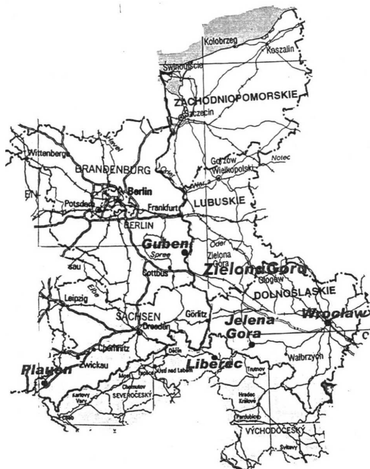
Mapa N°2: Euroregion tekstylny.