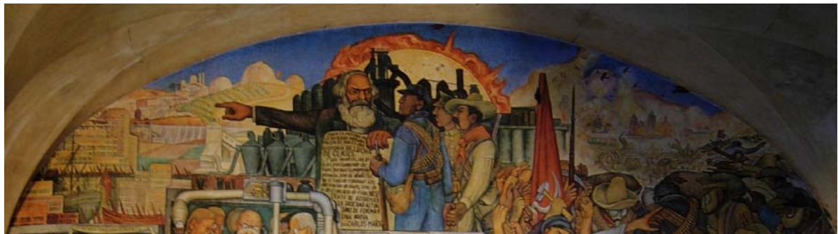
Figure 2, Diego Rivera (1886-1957) «El mundo de hoy y de mañana ». Fresque, 1934-1935. 7,49x8,85.