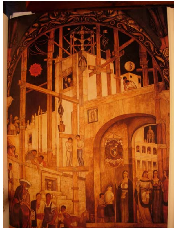
Figure 1, Roberto Montenegro (1885-1968) « La reconstrucción de México por obreros e intelectuales » ou « La Fiesta de la Santa Cruz », 1923-1924. Fresque, 5x 8=40m.