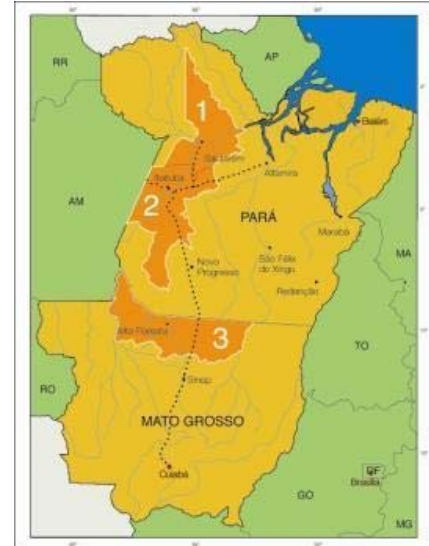
Figure 1 : Les trois microrégions d'intervention du Projet Diálogos : 1 « Baixo Amazonas », 2 « BR-163 », 3 « Portal da Amazônia »

Ce processus, classique en Amazonie, correspond au vieillissement de la frontière et à la structuration de l'espace géographique qui se fait d'autant plus rapidement que la pression et les intérêts politiques sont forts. Si dans le Portal donc, la proposition de développement territorial semble aller dans le sens des processus sociaux, pour le territoire de la BR-163 la situation est plus ambiguë. Bien que l'émancipation aille à l'inverse de leur nécessaire réunion au sein du projet de développement territorial, le fait que ces nouveaux municipes aient appartenus à la même entité est par contre positif.