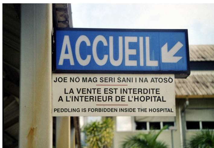
Illustration 2 : pancarte dans le jardin intérieur de l'hôpital