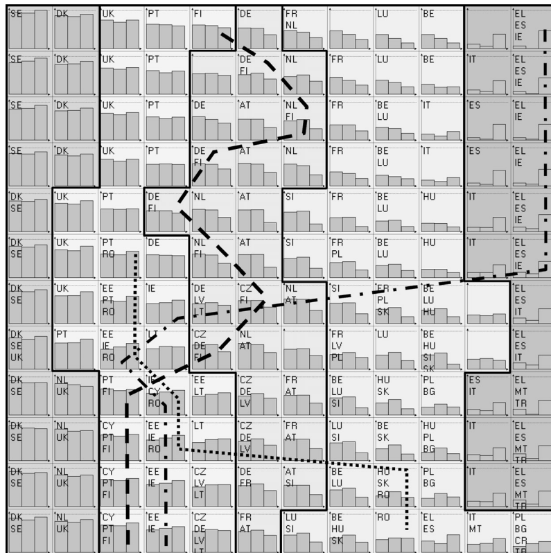
Fig. 2. Carte de Kohonen généralisée.

années de la période 1992-2003) et 12 colonnes. On observe une continuité dans la répartition des trois indicateurs à la fois dans la dimension ligne et dans la dimension colonne. Chaque année, les pays sont classés selon leurs performances en matière de taux d'emploi. On constate que la carte oppose les pays ayant les meilleures performances en termes de taux d'emploi, que ce soit total, des femmes ou des travailleurs âgés (le coté gauche de la carte) et les pays ayant de moins bonnes performances (coté droit de la carte). On remarque que le coin supérieur droit de la carte correspond aux taux d'emploi total et féminin les plus faibles, mais à des taux d'emploi moyens pour les travailleurs âgés. On note que les différences de performances se sont estompées dans le temps, essentiellement parce que les moins bonnes performances en matière de taux d'emploi se sont améliorées.