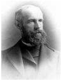
Granville Stanley Hall

psychologie fonctionnelle américaine, il fut le fondateur du The American Journal of Psychology en 1887 38 .