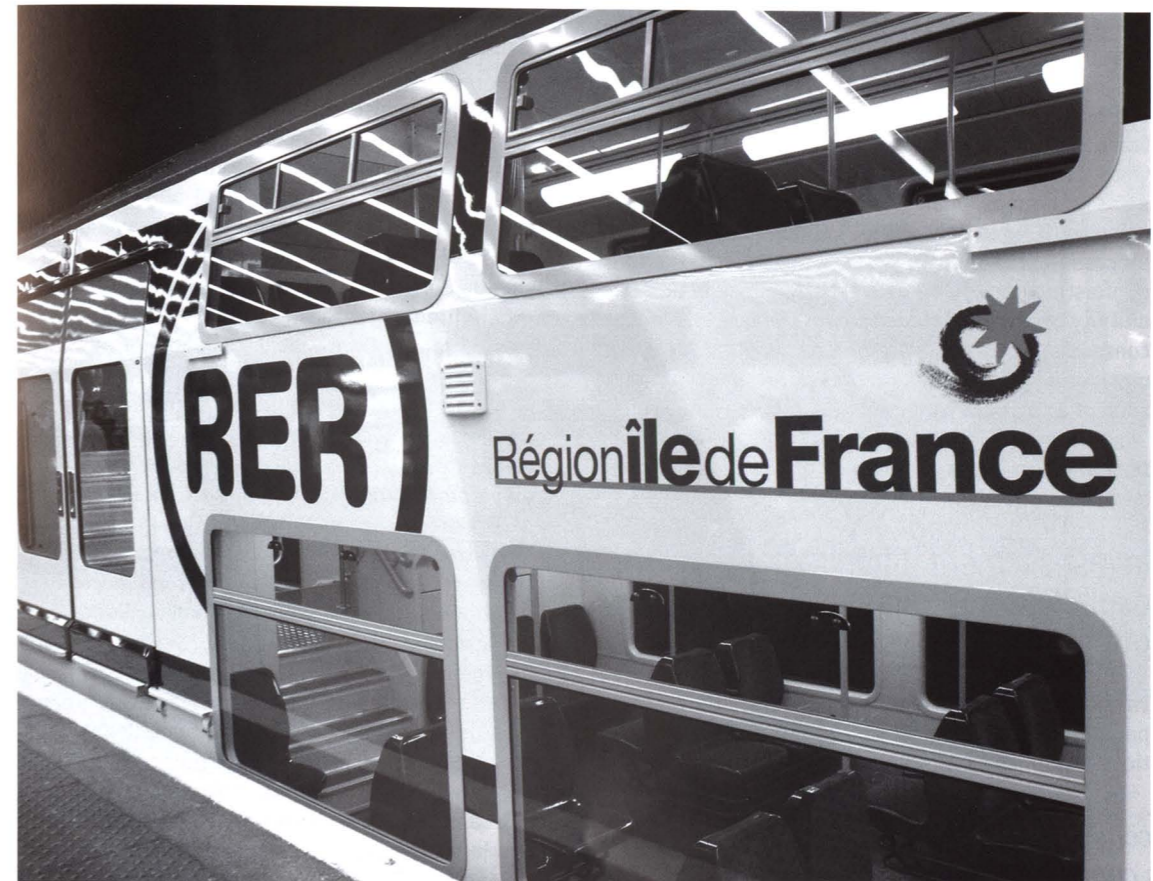
Le RER. « La mobilité sera de moins en moins subventionnée et les différents modes devront contribuer plus largement aux dépenses d'exploitation et d'investissements. »

Pour ce type de déplacements, la congestion touche plus les transports en commun que l'automobile. Aux heures de pointe, certaines lignes de métro et de RER ont de plus en plus de difficultés à écouler les flux de voyageurs et la vitesse moyenne des déplacements Tc est souvent faible de porte à porte. N'oublions pas que les Tc supposent un usage important de la marche