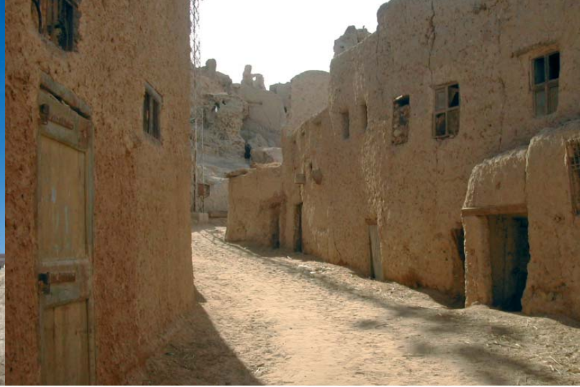
Ruelle parmi les premières maisons construites en contrebas de la forteresse de Shâlî à Siwa.

main-d'œuvre (entraide communautaire). Il convient de citer les deux formes prédominantes d'architecture en zone saharienne ou présaharienne : kasbah et ksour, toutes de terre. Le ksar (ksour au pluriel en arabe, ighrem et igherman au pluriel en berbère) est un ensemble d'habitations accolées les unes aux autres pour former un habitat compact entouré d'un mur d'enceinte — éventuellement avec tours de guet — qui présentait un avantage défensif mais l'inconvénient de limiter son développement. L'entrée (souvent en chicane) est contrôlée, la place centrale est l'espace public principal et les ruelles très étroites sont souvent couvertes (les maisons se rejoignent au niveau du premier étage) offrant un espace public secondaire avec banquettes. Les ksour sont des unités politiques dirigées par un conseil local qui légifère sur l'organisation de l'espace urbain. Les kasbah (très présentes au Maroc) sont des demeures de seigneurs locaux, fortifiées par d'épaisses murailles et des tours ( borj en arabe) d'angles crénelées, souvent ornées d'une décoration géométrique de briques de terre crue. Avec une forte expansion au XIX e siècle 6 concomitante de l'effritement de l'organisation égalitaire et l'émergence du pouvoir central ( maghzen ), les kasbah ( tighremt ) s'imposent au sud de l'Atlas marocain 7 : souvent isolés et situés en positions dominantes, ces édifices d'une famille jouaient un évident rôle politique d'ostentation et de contrôle régional 8 . Un troi-