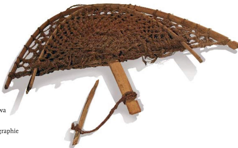
Piège à oiseau Égypte, oasis d'Amun-Siwa XX e siècle Bois, fibre végétale Genève, Musée d'Ethnographie

20 - Battesti V., 2006 – « "Pourquoi j'irais voir d'en haut ce que je connais déjà d'en bas ?" Comprendre l'usage des espaces dans l'oasis de Siwa ». In Battesti V., Puig N. (dirs) : Terrains d'Égypte, anthropologies contemporaines . Le Caire, CEDEJ, vol. 3, série 3 - Égypte/Monde Arabe : 139-179.