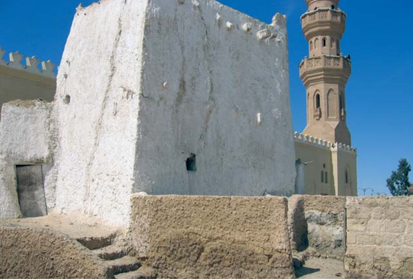
À Siwa : tombeau du saint Sîdî Suleyman (architecture de terre blanchie à la chaux) et, en arrière-plan, la mosquée moderne offerte par le roi Farouk.