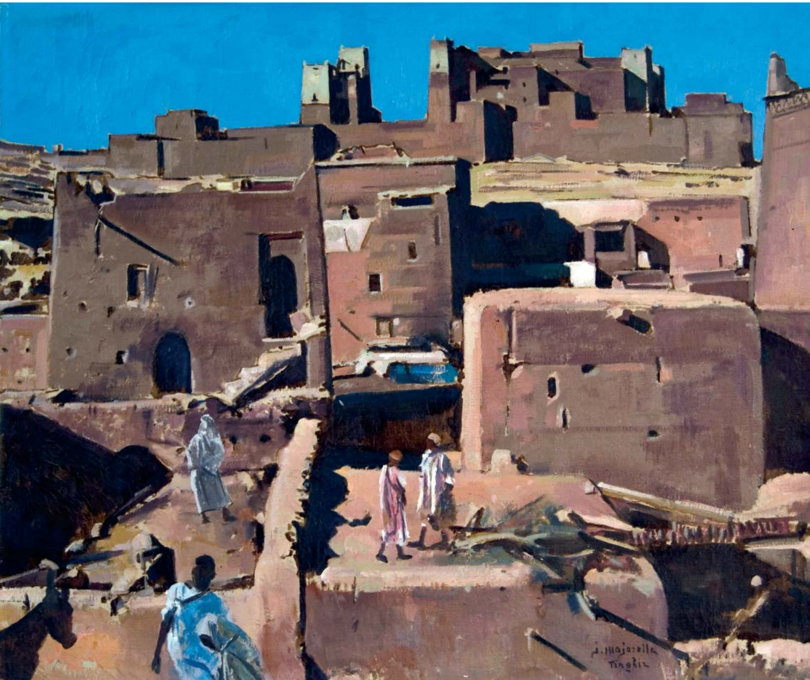
J. Majorelle La Casbah de Tinghir Huile sur toile Narbonne, Musée d'art et d'histoire