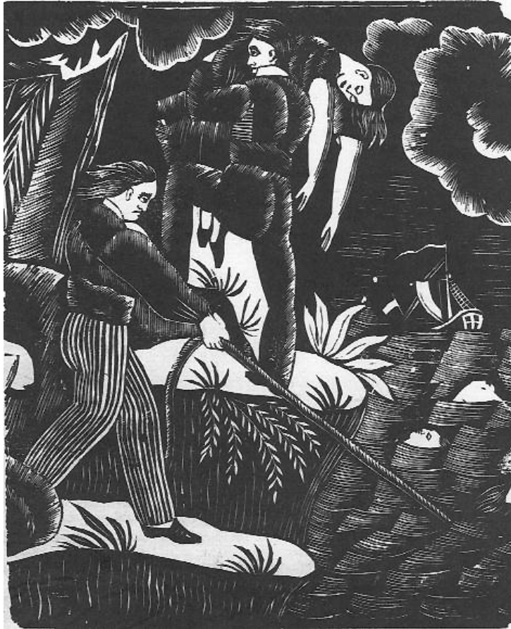
Illustration 5 (voir légende et source page précédente)