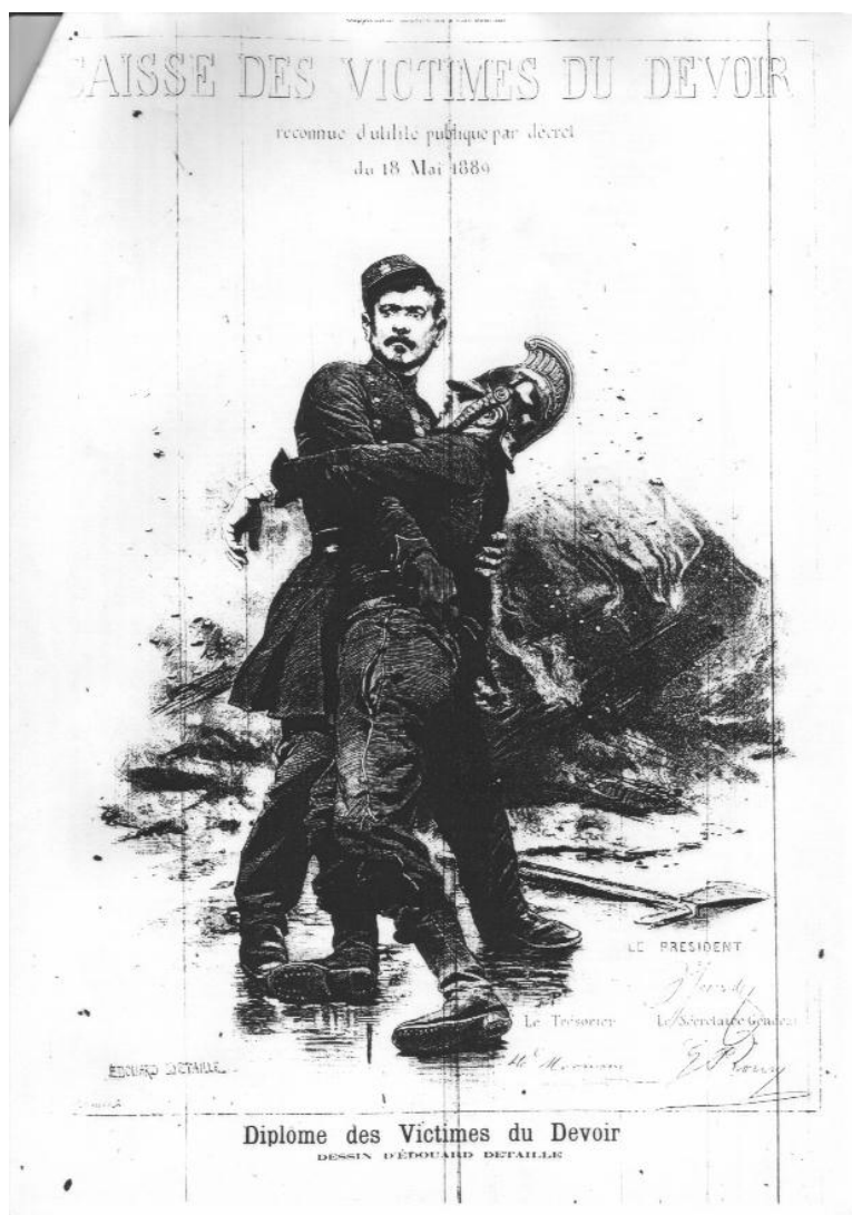
Illustration 1, tirée du Supplément Illustré du Petit Journal du 01 mai 1894