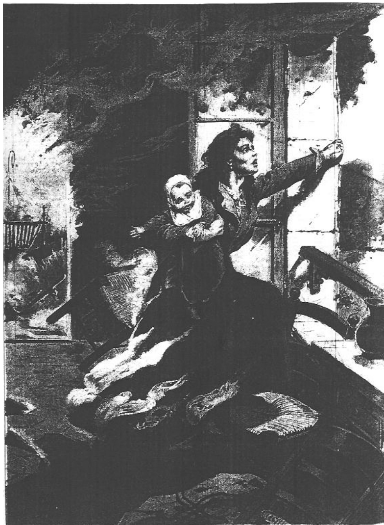
MORTE POUR SAUVER SON ENFANT

Illustration 3, sous le titre "Morte pour sauver son enfant", dernière page tirée du Supplément Illustré du Petit Journal du 21 octobre 1900