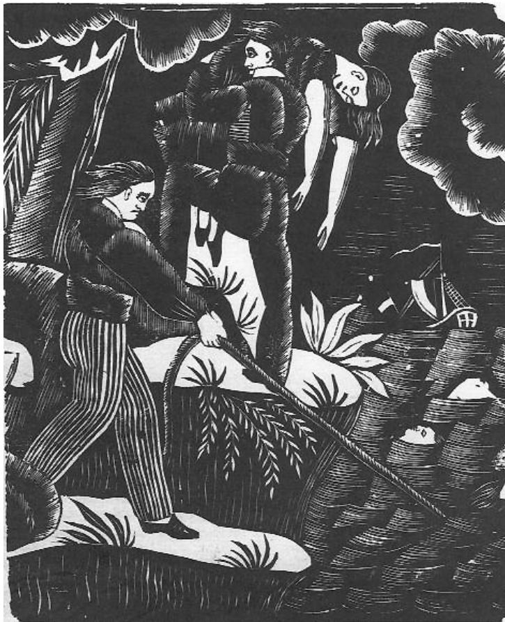
Illustration 5 (voir légende et source page précédente)