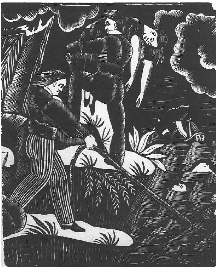
Illustration 5 (voir légende et source page précédente)