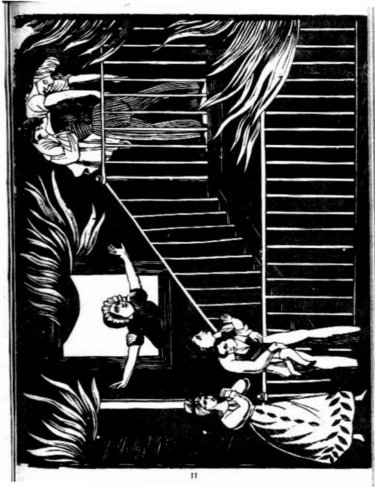
Illustration 4 et illustration 5 (page suivante) extraites d'un ballot de colporteur retrouvé au XX e siècle à Condé-sur-Noireau par un collectionneur et précurseur dans l'étude des occasionnels. Elles sont reproduites dans l'un de ses ouvrages : René Helot (1932), Canards et canardiers en France et principalement en Normandie. Etude accompagnée de 14 réimpressions de grands bois populaires ayant servi à illustrer des canards , Paris, Librairie Historique Alph. Margraff, s.d., 37 pages + ill. (pages illustrées non paginées)