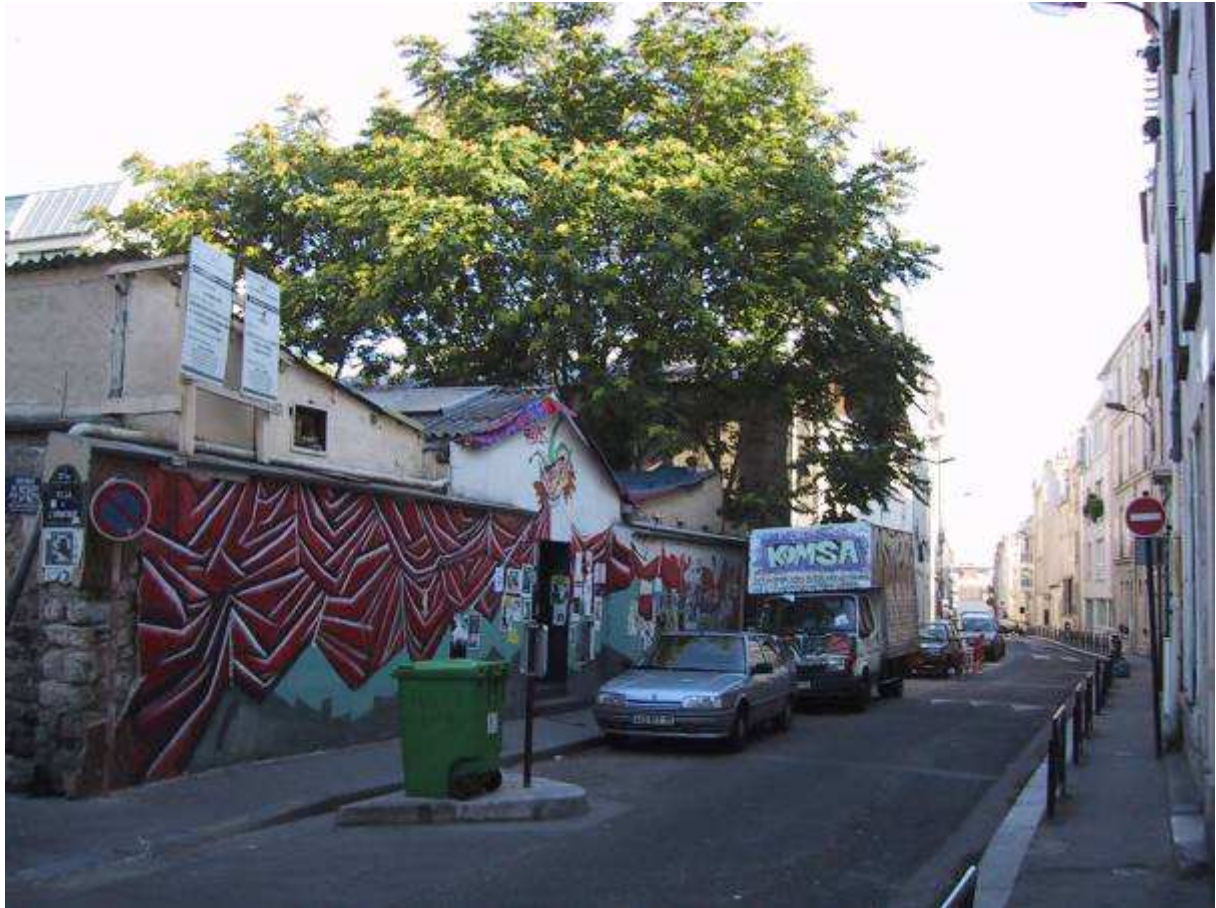
Cliché 1 : Le Théâtre de Fortune peu avant l'expulsion de ses occupants

« Théâtre de l'aurore ») qui a quitté les lieux pour exercer en province. Les bâtiments redevenus vacants ont rapidement été transformés en un squat artistique : le « Théâtre de Fortune » 14 .