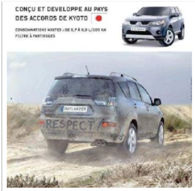
Figure 1 – Exemples de visuel mis en avant par les associations écologistes