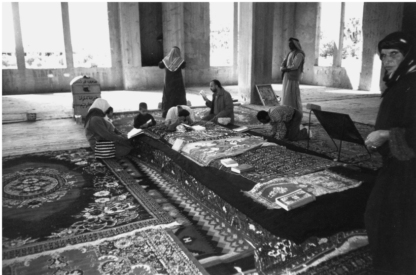
Pèlerins châwaya au mausolée d'Ammar ben Yâsir. Cl. M. Ababsa (2001).

Les pèlerins Chawâya sont en majorité des femmes, vêtues de la tenue des bédouines, deux foulards fins et colorés noués sur la tête, des tatouages pour les plus âgées, des chaussures en plastique qui témoignent d'une pauvreté relative. Elles ne pleurent pas, mais embrassent et caressent les tapis et les corans, et laissent des tapis pour qu'ils se chargent de la baraka des saints. Au sujet des semi-nomades de sa tribu Beggâra, située sur l'Euphrate en aval des 'Afadla, Naffakh écrit en 1971 que « le domaine surnaturel de la religion et de la magie est celui qui a subi le moins de changements. La plupart des Beggâra gardent encore les mêmes croyances qui étaient jadis celles de leurs ancêtres. L'organisation du monde surnaturel correspond toujours à un schéma qui n'a pas, ou guère, varié » (Naffakh, 1971, p. 140).