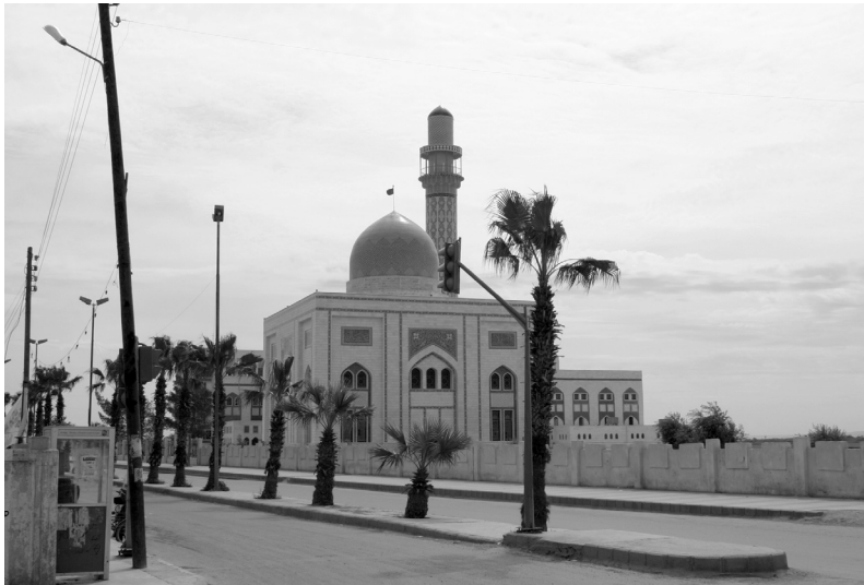
Les mausolées chiites de Raqqa. Cl. F. Cristofoli (2004).

secrétaire du Prophète 4 . Lancés en 1988, les travaux ont été interrompus entre 1994 et 2001, en raison d'un différend financier entre la Syrie et l'Iran, disent les Raqqawî . L'économie iranienne a connu une récession suite à la baisse du cours du pétrole en 1994, et ce n'est qu'en 1998 que de nouveaux accords économiques furent signés entre la Syrie et l'Iran ( Syrie et Monde Arabe , février-mars 1998) 5 . Selon la municipalité de Raqqa, les mausolées devaient être achevés à la fin de l'année 2004, avant que ne débute la construction de tout un complexe hôtelier à l'est du site, sur d'anciens terrains agricoles jouxtant le cimetière de Siffîn.