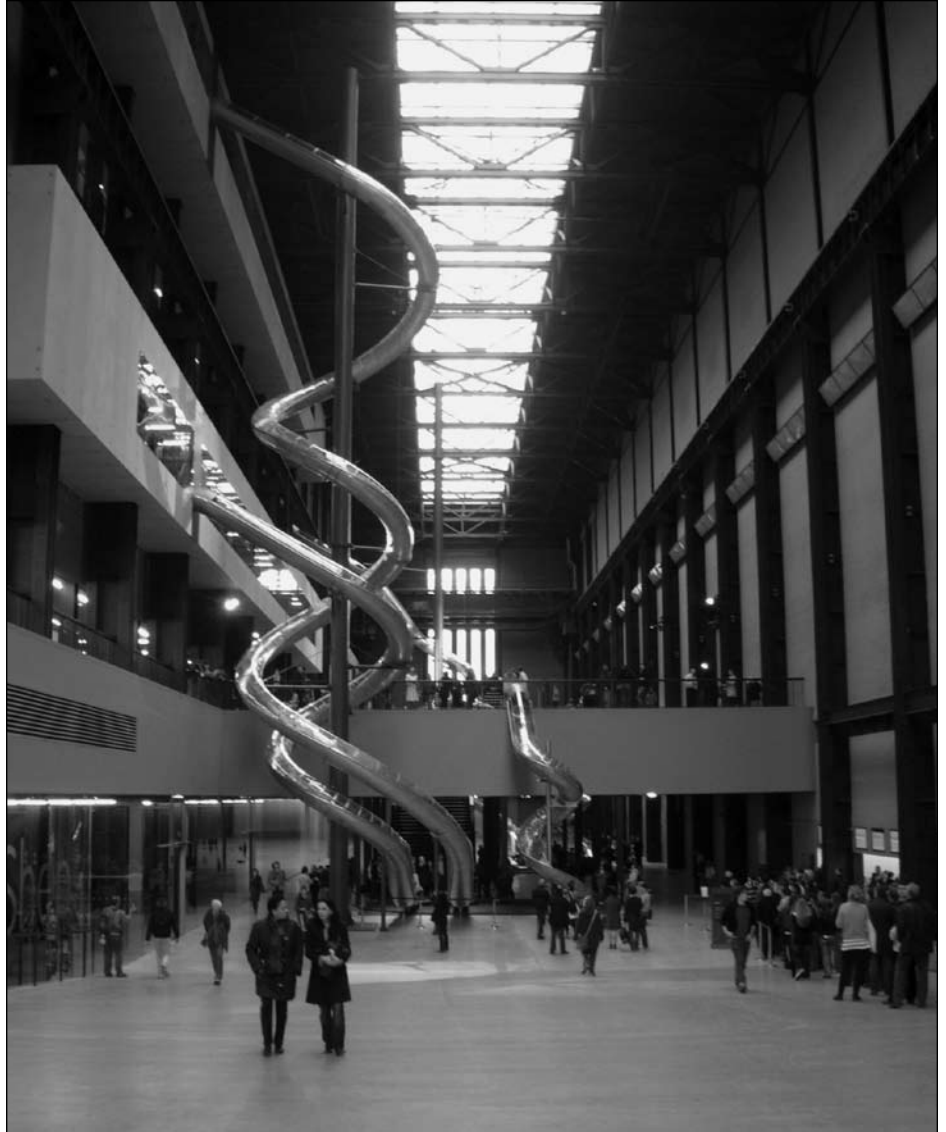
Illustration 2 : Les toboggans de Carsten Höller, Unilever Series, Turbine Hall, Tate Modern, Londres (10 octobre 2006 – 15 avril 2007).