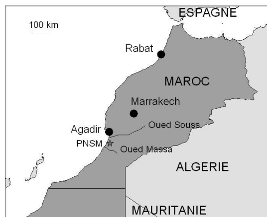
Carte 1: Situation du Parc National de Souss Massa

Le Parc National du Souss Massa (PNSM) est un espace d'analyse intéressant pour mieux préciser les enjeux d'un développement durable et comprendre les contraintes à surmonter. Il révèle plus largement les difficultés dans la mise en œuvre d'un développement équilibré, dont les populations locales seraient à la fois les bénéficiaires et le moteur.