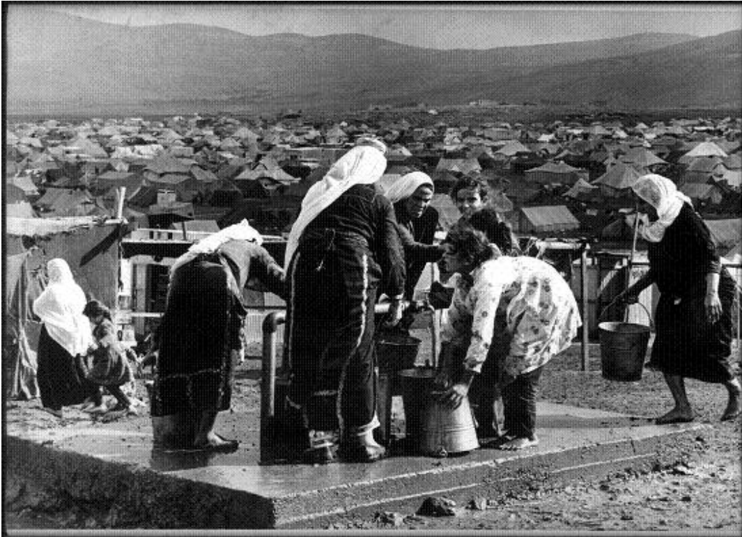
Photo : Femmes réfugiées à la source d'eau du camp de Baqaa, Jordanie, 1968

fil des années l'un des symboles les plus marquants de la préservation d'une identité spécifiquement palestinienne en exil, fondée sur la mémoire de la terre perdue de Palestine et articulée autour des structures familiales ou claniques traditionnelles (Dorai, K., 2005 ; Sanbar, E., 1984). [5] Champ d'action privilégié, mais non exclusif, de l'UNRWA, les camps témoignent également de la responsabilité des Nations Unies dans la prise en charge humanitaire et le règlement politique de la question des réfugiés. [6]