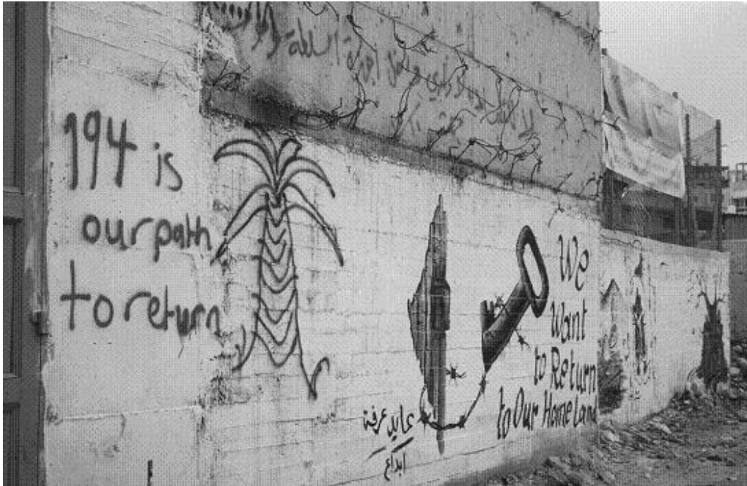
Photo : Images du 'droit au retour', camp de Dheisheh (Cisjordanie), 2000.)