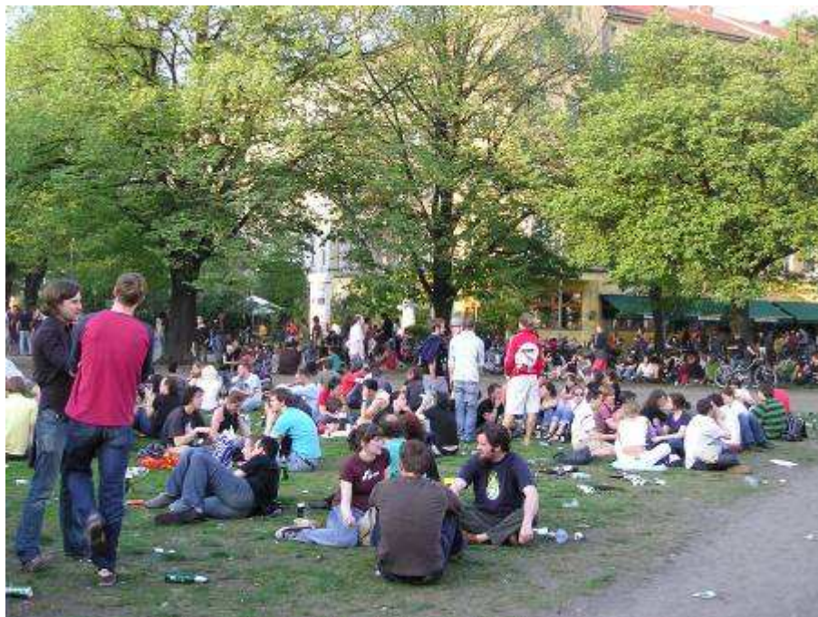
Document 6. Kreuzberg, Oranienstrasse, après la manifestation du 1 er mai

Depuis les années 1970, Berlin-Ouest est aussi devenu une ville très attractive pour des groupes sociaux fortement ancrés à gauche, porteurs d'idéologies alternatives et fers de lance de la contestation politique. Ces groupes, en général constitués de jeunes citadins, se sont largement réappropriés les pratiques traditionnelles, conformes à leur représentation de la ville et de la sociabilité publique, fondant une « nouvelle culture urbaine » (Tomas, 2001). Le pique-nique répond bien à leur besoin de rencontre avec autrui et de convivialité, notamment à l'échelle du quartier. Ainsi, hier comme aujourd'hui, les pique-niques réunissant les habitants d'un quartier ou les membres d'une association ne sont pas rares dans les parcs, dans les squares ou dans les jardins de locaux associatifs. Si la dimension militante s'est quelque peu effacée au profit des loisirs, l'héritage demeure vivace. Le pique-nique se teinte alors d'engagement politique. L'exemple du 1 er mai à Kreuzberg, haut lieu de la contestation politique à Berlin depuis les années 1970, en témoigne (doc. 6) : outre le défilé et les diverses manifestations, les participants achèvent le plus souvent leur journée par un pique-nique très simple, autour de sandwiches et de bières, sur une place ou dans un parc. Ce genre de pique-nique militant se retrouve aujourd'hui dans les autres métropoles européennes, et notamment à Paris.