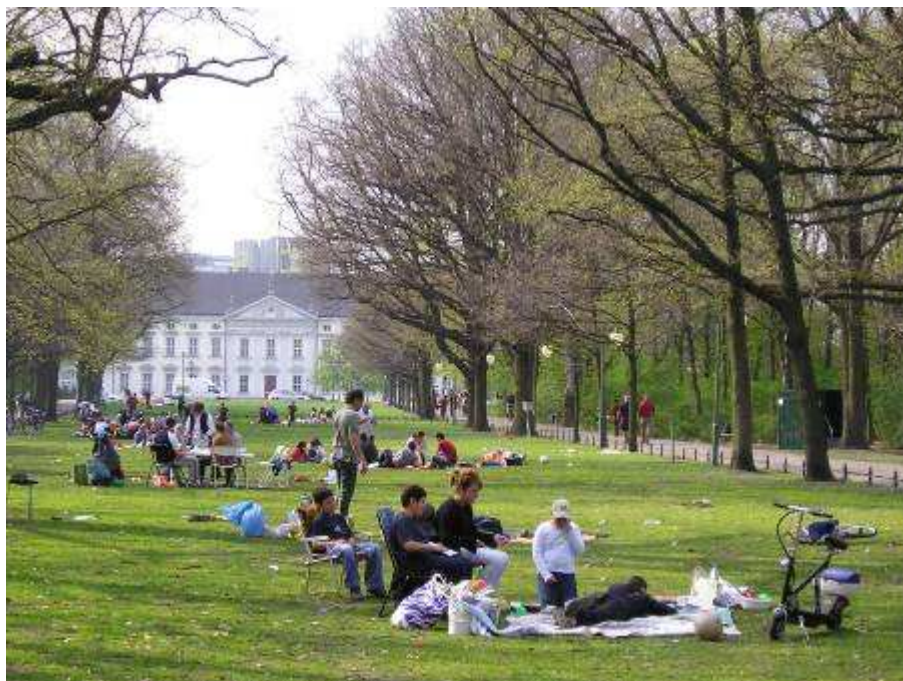
Le Tiergarten est l'un des lieux privilégiés du pique-nique à Berlin, et ce, dès avant la réunification.

Ce tableau ne saurait être complet sans l'évocation des espaces périphériques, de plus en plus fréquentés pour le pique-nique et pour d'autres activités de plein air : « [Alors] même que les espaces publics se renouvellent à l'intérieur des villes, ils connaissent en périphérie, voire en pleine campagne et au-delà même de l'œkoumène, un développement exceptionnel sous la pression de citoyens en quête de nature » (Tomas, 2001, p. 83). Il s'agit en premier lieu des forêts périurbaines, que ce soit à Berlin où elles sont nombreuses ou à Istanbul avec notamment la forêt de Belgrade, au nord de la ville (doc. 4). Si les concentrations y sont moins importantes, on n'en observe pas moins, là encore, certains lieux privilégiés, en particulier les plus accessibles par la route (à Istanbul) ou les transports en commun (à Berlin). Les îles aux Princes, au large de la rive asiatique d'Istanbul, sont elles aussi devenues un espace de pique-nique. Les îles offrent aux citoyens un cadre agréable, préservé des nuisances puisque la circulation automobile y est interdite, et relativement accessible grâce au service de vapur 4 . Pour autant, la pratique n'y est pas aussi développée qu'ailleurs, parce qu'il n'est pas aisé de transporter tous les objets du pique-nique sans voiture, et il faut tout de même pouvoir s'offrir la traversée en bateau.